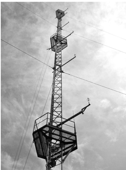
Slika 1. Meteorološki toranj na Pometenom brdu kraj Dugopolja (sjeveroistočno od Splita), na oko 618 m nadmorske visine. Toranj pripada Energetskom institutu Hrvoye Požar (EIHP) u suradnji s Institutom Rade Končar. Mjerni uređaji, međusobno udaljeni oko 10 m, visokog uzorkovanja podataka pripadaju EIHP-u te Geofizičkom odsjeku PMF-a u suradnji s Državnim hidrometeorološkim zavodom. Žice sa strane pridržavaju toranj. Na nebu se vide i tanki oblaci.

U nastavku ćemo navesti neke činjenice o mjerenju i numeričkom modeliranju spomenutog strujanja; fokus će biti na uvođenje jednog od najboljih analitičkih (teorijskih) modela vjetra obronka (Prandtlov model). Uz diskusiju, pokazat ćemo primjere i zadati nekoliko prikladnih zadataka. U ovom pristupu neophodno je uvesti potrebne definicije i objasniti spregu između osnovne jednadžbe gibanja (Newtonov zakon gibanja za fluide, ovdje zrak) i zakona termodinamike.