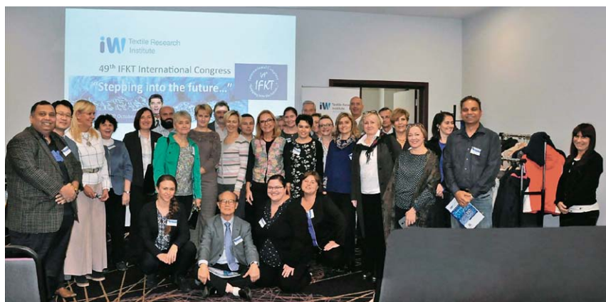
Sl.5 Sudionici IFKT 2018 kongresa, Lodz, Poljska

odjeću, sl.4. Osnovni se uzorci izrađuju ručnim radom, potom se uzorak pokuša izraditi na najnovijim pletaćim strojevima. Na ovaj se način stvara moderni nacionalni uzorak koji ima podlogu u kulturi i tradiciji irskog naroda. Uzorak se želi ugraditi u kolekcije odjeće svih uzrasta. Osim navedenih tema, obrađene su još mnoge vezane za analize materijala i primjene novih postupaka u izradi i kontroli pletiva. Posljednjeg radnog dana održan je sastanak Generalne skupštine na kojem su sudjelovali svi sudionici Kongresa i razmotrena su pitanja vezana za aktivnosti udruge u naredne dvije godine, sl.5. Sjeverna Irska je preuzela organizaciju jubilarnog 50. IFKT druženja s Kongresom. Prema preliminarnim informacijama, svečano okupljanje i Kongres će se održati u