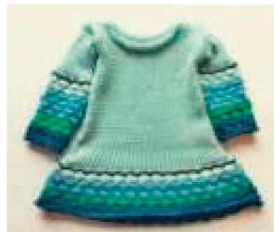
Sl.4 Kreacije pletene dječje odjeće inspirirane irskom tradicijom i kulturom (A. Gault)