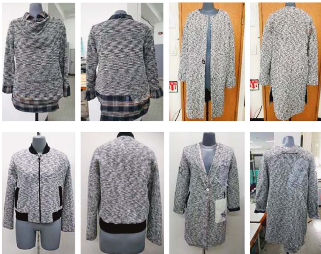
Sl.1 Odjevni predmeti od interlok pletiva sa stroja različite finoće, E6/24 (za žensku i mušku gornju odjeću bez podstave)

medicini, agrokulturi i tehničkom sektoru. Do sada su glavna područja poljskog izvoza: Ukrajina, Rusija, Bjelorusija, SAD i Švicarska.