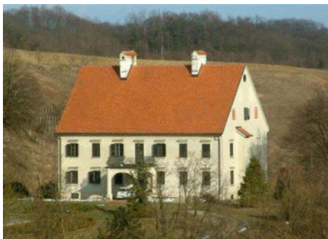
Slika 2. Dvorac Vižovlje 89