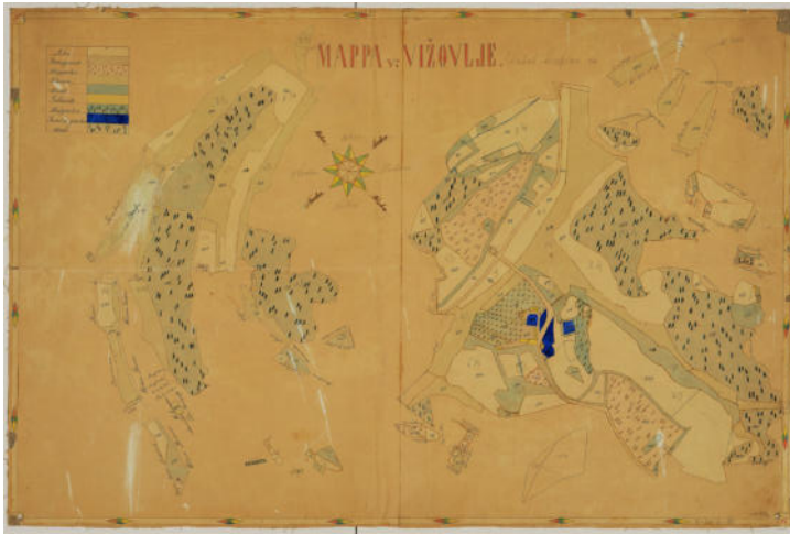
Slika 3. Felja, M. Vižovlje: mappa

Najstariji izvori koji omogućuju rekonstrukciju izgradnje i promjena građevinskoga kompleksa jesu Prva (1763–1787), Druga (1806–1869) i Treća (1869–1887) vojna izmjera Habsburške Monarhije 94 , katastarska karta autora M. Felje 95 , Ugarske katastarske karte iz 19. stoljeća 96 te nacrti gradnji gospodarskih objekata koje je naručio Josip Aleksandar Galjuf. 97