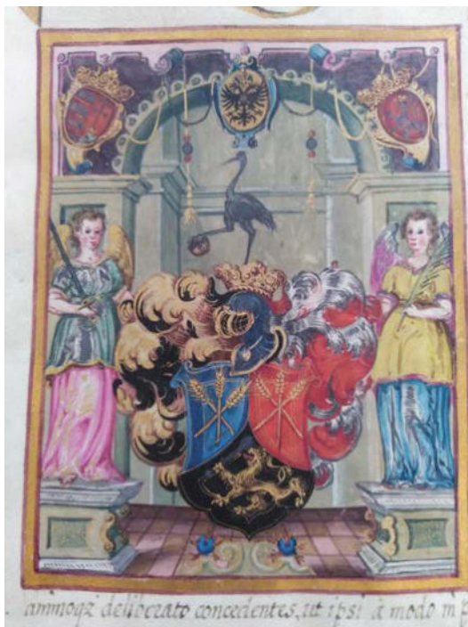
Slika 1. Grb obitelji Galjuf