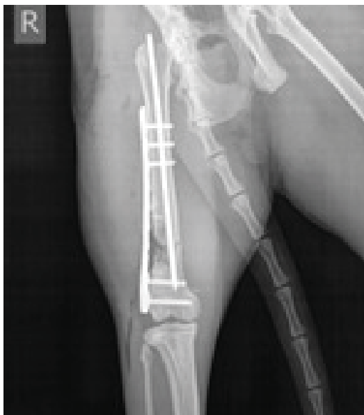
Slika 3. i 4. Profilna i sagitalna projekcija desne bedrene kosti mačke nakon osteosinteze pinom i pločom.

ka). Activity : aktivnost kosti nije vidljiva te nema znakova sanacije loma. Nema znakova osteomielitisa, prisutan je edem mekih česti. U meduli proksimalnog koštanog segmenta vidljiv je dio nareznog svrdla koji je odlomljen najvjerojatnije pri narezivanju korteksa pri pokušaju postavljanja priteznog vijka.