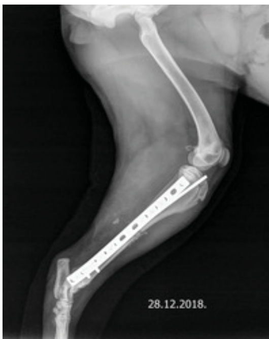
Slika 1. i 2. Profilna i sagitalna projekcija lijeve potkoljenice psa nakon osteosinteze tibije pinom i pločom.

Prvi primjer je procjena osteosinteze potkoljenice psa starog 11 mjeseci. Osteosinteza je učinjena pločom i intramedularnim pinom ( plate and rod construction, PRC ). Alignment : u profilnoj i sagitalnoj projekciji potkoljenice psa vidljivo je osovinsko poravnavanje. Apposition : anatomski repozicija koštanih ulomaka nije potpuna jer postoji manji koštani ulomak medijalno koji se ne poklapa u potpunosti s korteksom distalnog koštanog segmenta (slika 2). Fibula u poravnanju uz poklapanje korteksa u oko 50 %. Apparatus : ploča se doima dovoljno dugačka, udaljena od proksimalne fize tibije, no doima se prenisko postavljena u odnosu na talokruralni zglob (slika 1). Vijci u središnjem dijelu su monokortikalni, distalni vijak je također monokortikalan te blizu zgloba (granično). Dva vijka u distalnom dijelu su preduga te ulaze u fibulu. Intramedularni pin dovoljne je debljine (30 % medule) i dovoljno dugačak, postavljen pravilno, ali povijen u distalnom dijelu (pritisak vij-