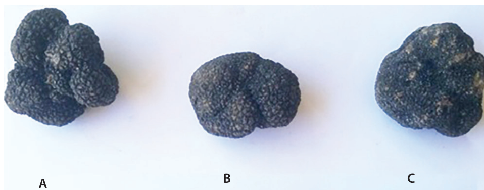
SLIKA 1. Crni ljetni tartufi pronađeni na lokacijama Maslenica (A), Žegar (B) i Rovanjaska (C)

In Figure 2 the agarose gel with the amplification results of the DNA of our samples is shown. The amplicon size (800 bp) obtained with the species-specific primers of T. aestivum (GRYNDLER ET AL., 2014) demonstrating that three collected fruiting bodies belong to that species.