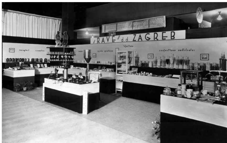
Slika 7. Rave na Kemijsko-farmaceutskoj izložbi 1934., Zagrebački velesajam.

godišnjaka, almanaha za farmaciju i kemiju, kodeksa specijaliteta, na stranicama strukovnih gasila. U vrijeme kada joj je proizvodnja u ekspanziji, promidžbeni prostor koji otvaraju stručne publikacije postaje ipak premalen za sve proizvode koji se žele oglasiti te se javlja potreba za intenzivnijom suradnjom i komunikacijom sa strukom (ljekarnicima i liječnicima) preko kojih se roba distribuira. Tvrtka stoga 1934. kreće u izdavanje vlastitog časopisa – mjesečnika pod nazivom Medicinsko-farmaceutska pošta .