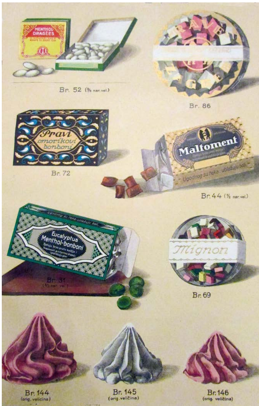
Slika 5. Reklama za Rave šećeriće. Publikacija Rave proizvoda 1924., vlasništvo obitelji Rac dinara, a i sljedeća će godina rezultirati dobrim poslovnim uspjehom. Tome