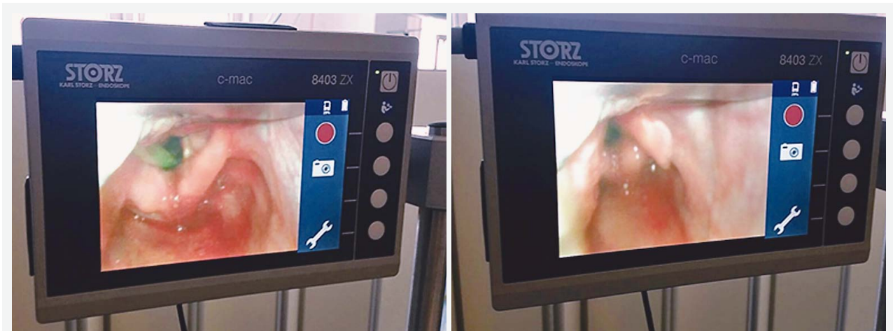
SLIKA 1. VIDEOLARINGOSKOPIJA BOLESNICE S OTEŽANOM EKSTUBACIJOM FIGURE 1. VIDEOLARYNGOSCOPY OF A PATIENT WITH DIFFICULT EXTUBATION

uredne vizualizacije i procijenjenog Cormack-Lehane-ova stupnja 1 intubirana je iz prvog pokušaja spiralnim endotrahealnim tubusom veličine 8 na dubini od 21 cm te je napuhan balončić. Poslije intubacije primijenjen je deksametazon u dozi od 8 mg iv., što je standardna procedura s obzirom na tip kirurškog zahvata.