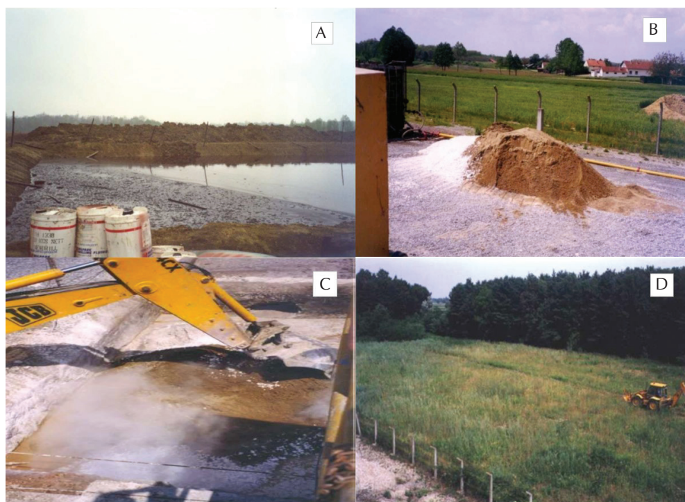
Slika 1 – Prikaz isplačne jame s tekućom fazom i postupak sanacije upotrebom građevinskih strojeva; A – isplačna jama, B – vapno i pijesak za sanaciju, C – miješanje ugušćenog otpadnog materijala s vapnom i pijeskom upotrebom bagera, D – isplačna jama nakon sanacije