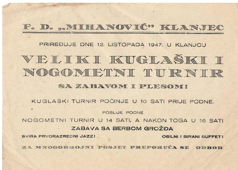
Slika 1. Primjer efemerne građe - promotivni letak