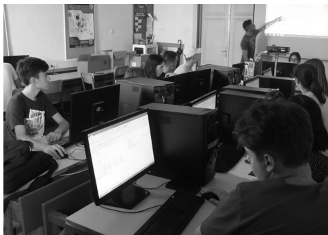
Slika 4. Svaka se riječ upijala na Radionicama o kreditima.

Već tradicionalno, zadnji je dan rezerviran za dovršavanje prezentacija i prezentiranje radova timova. Još su nas jednom oduševili svojom ozbiljnošću i predanošću zadacima i potvrdili kako je ljetna škola sjajna prilika za stjecanje važnih znanja i vještina, ali i novih prijateljstava.