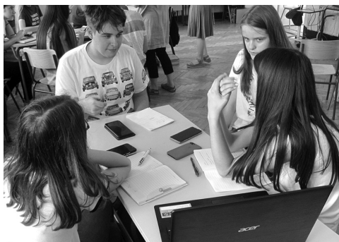
Slika 2. Organizacija posla i uvažavanje tuđih ideja najvažniji su sastojci timskog rada.