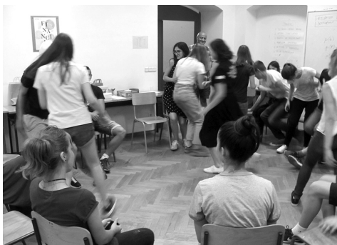
Slika 3. Da bi mozak bolje radio, svakog smo se jutro zagrijavali.

Cilj nam je bio dati učenicima slobodu da sami osmisle temu koju bi dublje proučavali i da na temelju njihovih ideja organiziramo timove i dodijelimo svakom od njih jednog mentora. Kako učenicima ideja nije nedostajalo, uspjeli smo oformiti pet timova koji su se zadnja dva dana škole bavili sljedećim temama: Ulaganje u nekretnine, Kriptovalute, Inflacija, Krediti i ulaganja te Uspoređivanje cijena.