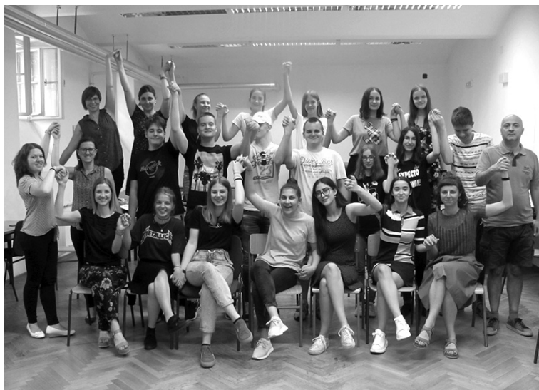
Slika 6. Zajednička fotografija polaznika i mentora ljetne škole.

Da bi se prijavili na ljetnu školu, polaznici su trebali popuniti online obrazac i navesti što ih je motiviralo da se prijave, što očekuju od radionica i kako im mogu doprinijeti. Njihovi odgovori najbolje sažimaju važnost i potrebu bavljenja ovom temom, a uvijek nas razveseli motiviranost polaznika i želja za usvajanjem novih znanja. Evo i isječaka nekih prijava: