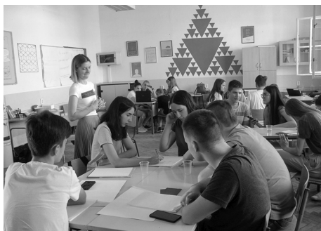
Slika 1. Računanju kamata pristupilo se jako ozbiljno.

Nakon nekoliko tema koje su bile dosta široke i zadirale u različita područja prirodnih, tehničkih ali i društvenih znanosti, vratili smo se korijenima i posvetili ljetnu školu financijskoj matematici. Smatrali smo da je upoznavanje učenika s financijama izuzetno važno, naročito jer smo na temelju iskustva u nastavi uočili da je znanje o toj temi jako oskudno, ali i da učenici nisu previše zainteresirani baviti se financijama. Prvo nacionalno istraživanje financijske pismenosti građana Hrvatske pokazalo je da je financijska pismenost najniža upravo kod populacije mladih, ispod 19 godina. Htjeli smo to promijeniti i učiniti ovu ljetnu