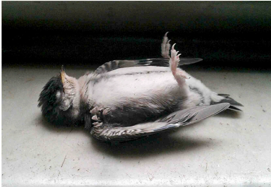
Fig. 1 - ©Francesca Catastini, Piccolo di rondine , 2013.

Mi è tornato in mente l'episodio dell'uccellino e il topo mentre mi apprestavo a lavorare a un progetto che ho iniziato circa un anno fa, ambientato in gran parte nei teatri anatomici. È una sorta di allegoria della conoscenza.