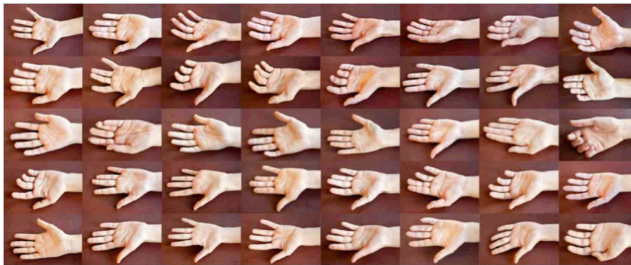
Fig. 4 - ©Francesca Catastini, dalla serie The modern spirit is vivisective (titolo provvisorio), 2013.

Per la serie The modern spirit is vivisective ho invitato degli studenti a prender parte come pubblico attivo alla realizzazione di due fotografie. Oltre a ritrarli con me all'interno del teatro anatomico dell'Archiginnasio di Bologna, ho chiesto loro di lasciarsi fotografare una mano.