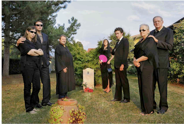
Fig. 3 - ©Francesca Catastini, Happiness#7 , 2009.

In un contesto come quello di Happiness , in cui i soggetti si trovano inseriti in un ritratto corale, benché la situazione sia data arbitrariamente, ciascuno è chiamato quasi ad autoritrarsi, ognuno è responsabile della propria immagine e di quella del gruppo. Tutto questo risulta ancora più evidente se si tiene conto della modalità di scatto con cui sono state realizzate le fotografie. Il timer posticipava di venti secondi l'apertura dell'otturatore, così da permettermi, una volta premuto il pulsante, di andarmi a collocare all'interno dell'inquadratura. Quindi, per partecipare allo "pseudo-evento" con la mia famiglia, al contempo la lasciavo sola di fronte alla macchina fotografica, senza il fotografo o un qualsiasi referente umano che li guardasse, con il rumore del timer automatico come unico segnale al quale attenersi. Ciascuno in balia di se stesso, chiamato a decidere che significato dare al gruppo attraverso la sua "indispensabile presenza". E poiché, ad esempio, Happiness#7 (Fig. 3) fa riferimento a un evento luttuoso, la perdita del cane, quasi tutti i componenti della famiglia hanno assunto un'espressione di cordoglio.