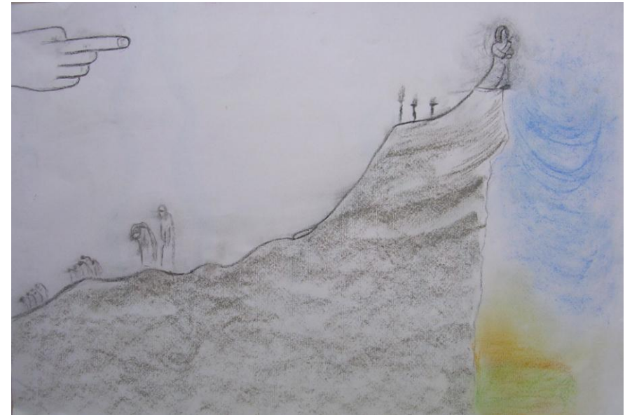
Fig. 2 – Psiche sulla rupe

Psiche è disperata mentre si trova sola sulla rupe, all'improvviso però viene salvata da "un'auretta di Zefiro" che la solleva e poi la depone su un praticello con la reggia sfarzosa di Eros nelle vicinanze. Eros si è innamorato di Psiche disobbedendo alla madre Venere che la voleva sposata a un uomo molto vile. Per Psiche la casa dell'origine è ormai sbarrata e inaccessibile. La fanciulla però può ora aprirsi alla crescita e alla scoperta della sua