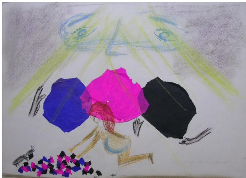
Fig. 12 – Psiche riordina attrezzi e sementi

feroci parte del loro vello. L'immagine sembra suggerire che il processo riparativo è ormai in atto e si apre a momenti rasserenanti con il recupero di uno sguardo materno conciliato (Fig. 14).