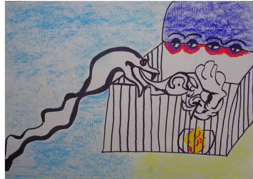
Fig. 9 – I pericoli paiono incombere come in un delirio

bia verso le sorelle che l’avevano ingannata e si vendica facendole morire. Le due sorelle invidiose ora non servono più, sono riassorbite da Psiche che finalmente prende coscienza di “quella sua sciagurata invidia che ha dato un colpo mortale e di cui aveva un vago sentore all’inizio della storia” (Fig. 11).