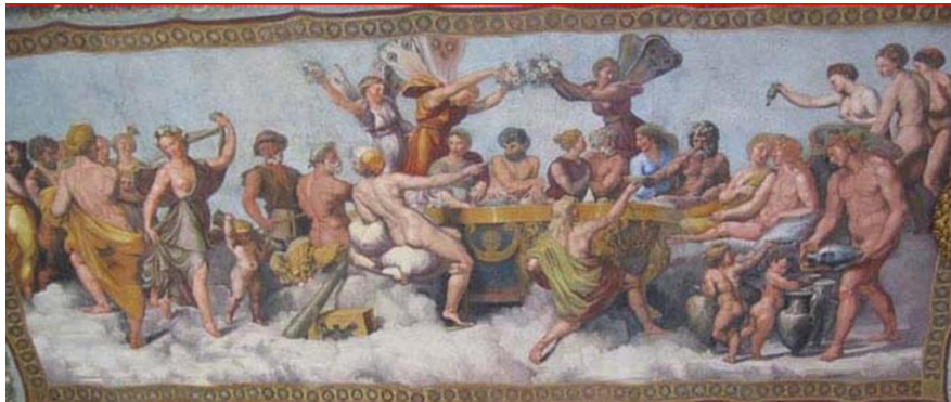
Fig. 17 – Raffaello, Convivio degli dèi , 1517 ca.