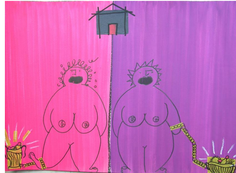
Fig. 7 – L'invidia delle sorelle di Psiche

Psiche coglie l'identità del suo sposo e comincia a com-