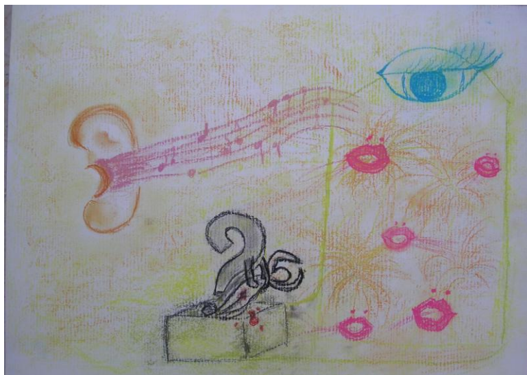
Fig. 4 – Suoni e voci della reggia di Eros

Venere, invidia che ha dato origine a tutta la vicenda. Le due sorelle, quasi due parti scisse di Psiche, istigano curiosità e paura in lei rispetto allo sposo misterioso. La curiosità e le paure che Psiche non si era mai permessa di vivere in prima persona, vengono ben rappresentate come minacciosi elementi proiettati all'esterno (Fig. 8).