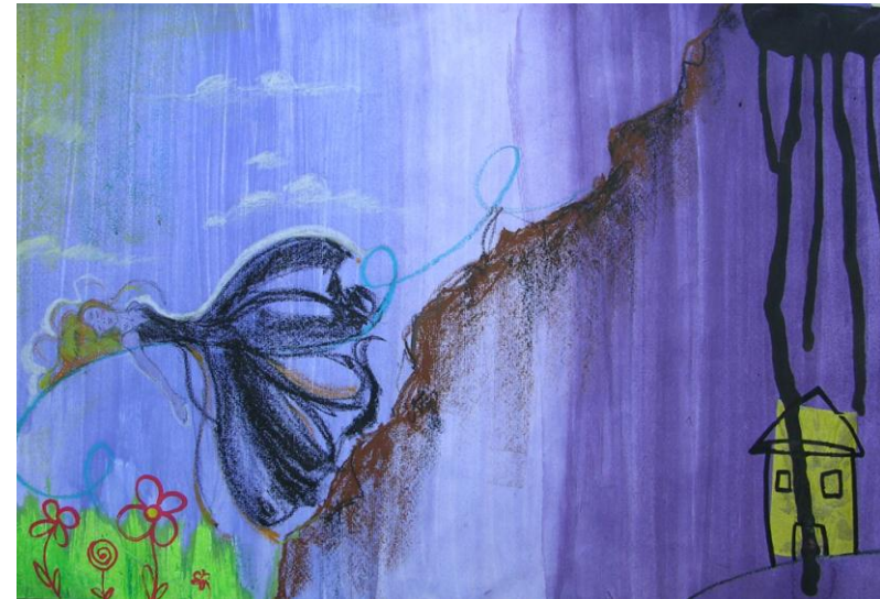
Fig. 3 – Psiche posata su un praticello

Suggestiva la rappresentazione delle mani misteriose, che nella reggia di Eros sono al servizio di Psiche. Interessante notare la realizzazione pittorica di mani concrete, mentre nella fiaba, altamente poetica, Psiche è servita da “soffi d’aria” che le fanno arrivare quanto lei vuole. Questa concretizzazione ci fa ricordare la “verticalità” della fiaba così ben sottolineata dalla Von Franz nel suo saggio (Fig. 5). Ecco ora ricomparire in scena le sorelle maggiori. Eros aveva impedito a Psiche di uscire dal prezioso bozzolo-prigione da lui creato attorno alla fanciulla. Eros aveva vietato a Psiche qualsiasi incontro con il mondo esterno e in particolare con le due sorelle, come portatrici di rovina. Psiche però disobbedisce e, per la prima volta nella storia, si pone come un soggetto attivo – lei portata fino a quel momento in modo passivo dagli eventi. Apuleio infatti ce la descrive come “ingenua”, “troppo semplice”, “debole di corpo e di carattere”. Psiche ora si riscatta. Le sorelle su sua insistente richiesta, vengono portate anche loro dall’“auretta di Zefiro”