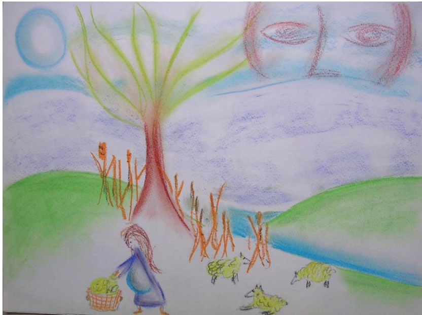
Fig. 14 – Psiche recupera il vello delle pecore

direbbe l'altra faccia del padre non protettivo della origine. Psiche può quindi salire sull'Olimpo insieme al suo sposo sotto lo sguardo di due genitori recuperati e sufficientemente buoni (Fig. 16).