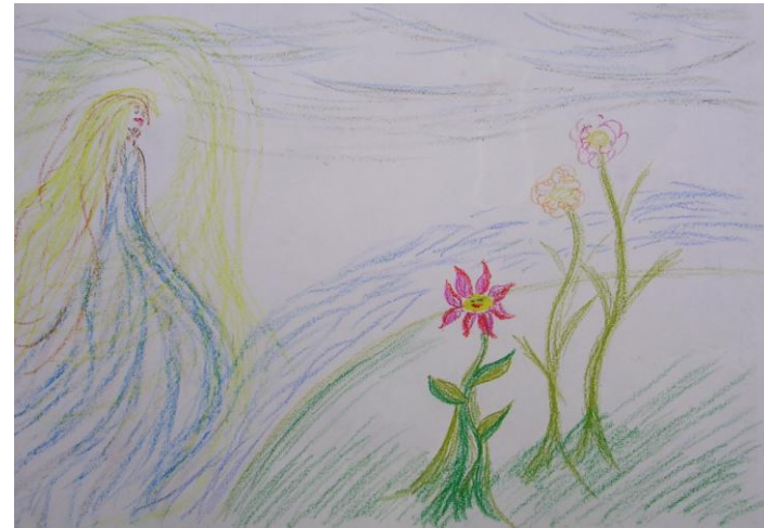
Fig. 1 – Psiche

sembra mostrare una Psiche stereotipata e vuota, vuota di una identità davvero sua (Fig. 1).