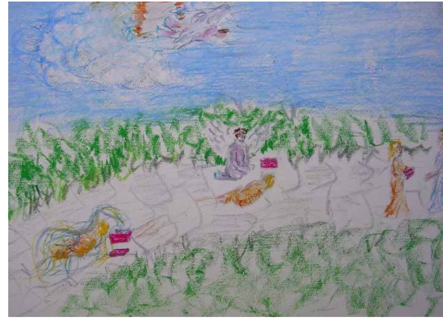
Fig. 15 – Psiche risale dagli Inferi

Fiaba a lieto fine, quella di Amore e Psiche, come tutte le