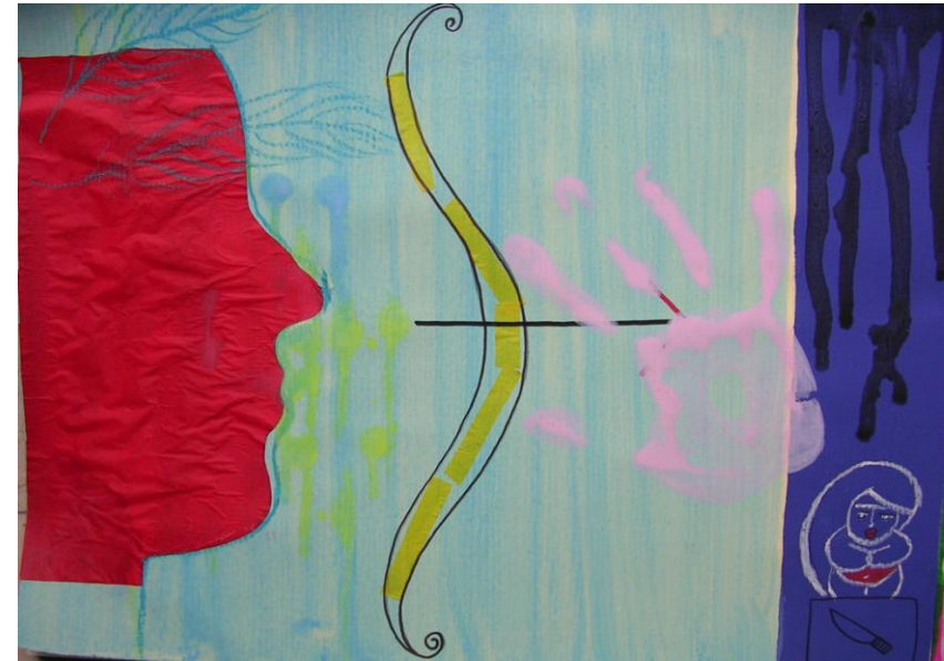
Fig. 11 – Psiche prende coscienza della sua invidia

Psiche poi prosegue nel suo cammino di crescita e di individuazione “perché, si dice, non ti consegni volontariamente alla tua sovrana e facendo atto di piena seppur tardiva sottomissione, non cerchi di ammansirne il tremendo furore?”. Ella allora incontra Venere, ben rappresentata nella sua carica persecutoria (Fig. 13). Accetta di ripa-