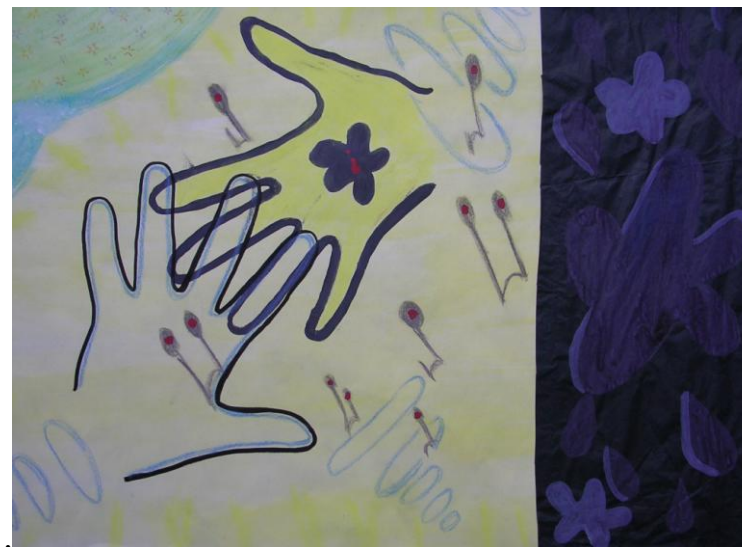
Fig. 5 – Mani misteriose nella reggia di Eros

Venere, invidia che ha dato origine a tutta la vicenda. Le due sorelle, quasi due parti scisse di Psiche, istigano curiosità e paura in lei rispetto allo sposo misterioso. La curiosità e le paure che Psiche non si era mai permessa di vivere in prima persona, vengono ben rappresentate come minacciosi elementi proiettati all'esterno (Fig. 8).