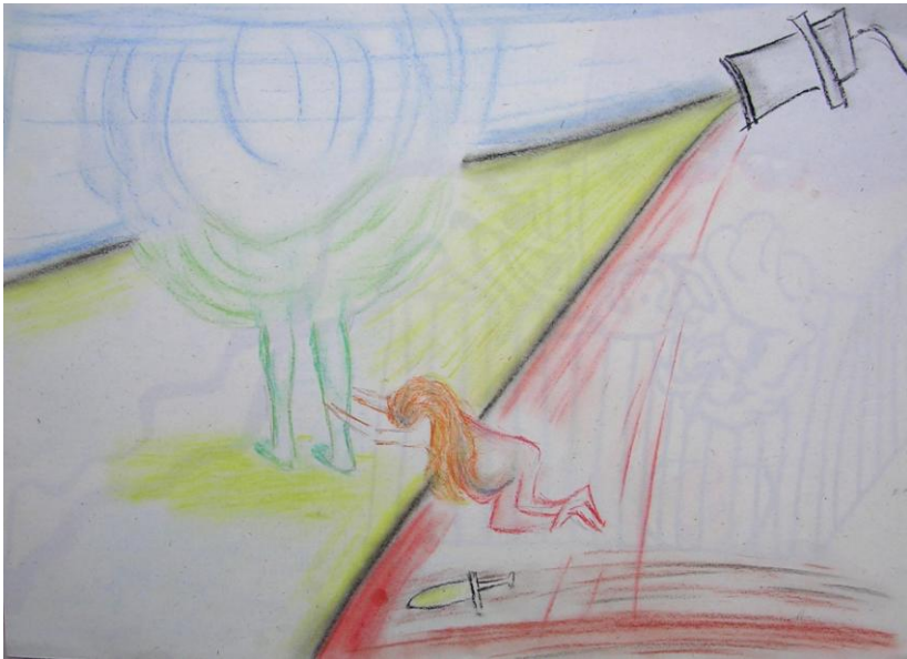
Fig. 10 – Eros fugge da Psiche

Psiche poi prosegue nel suo cammino di crescita e di individuazione “perché, si dice, non ti consegni volontariamente alla tua sovrana e facendo atto di piena seppur tardiva sottomissione, non cerchi di ammansirne il tremendo furore?”. Ella allora incontra Venere, ben rappresentata nella sua carica persecutoria (Fig. 13). Accetta di ripa-