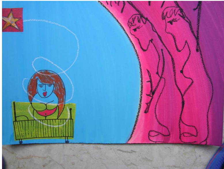
Fig. 8 – Le sorelle di Psiche istigano in lei curiosità e paura

bia verso le sorelle che l’avevano ingannata e si vendica facendole morire. Le due sorelle invidiose ora non servono più, sono riassorbite da Psiche che finalmente prende coscienza di “quella sua sciagurata invidia che ha dato un colpo mortale e di cui aveva un vago sentore all’inizio della storia” (Fig. 11).