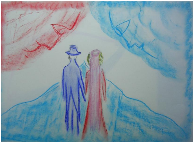
Fig. 16 – Eros e Psiche salgono sull'Olimpo

so passo nella successione invidia-riparazione-individuazione. Il gruppo, formato da cinque giovani donne, ha seguito il processo di individuazione della protagonista femminile, mentre il processo evolutivo di Eros, che nella storia si emancipa dalla influenza materna e si innamora di Psiche, compiendo un atto di disobbedienza,