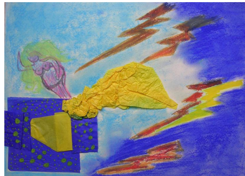
Fig. 13 – Psiche incontra Venere

Psiche poi scende nella profondità degli Inferi e recupera quel famoso barattolino che, con sua sorpresa, contiene