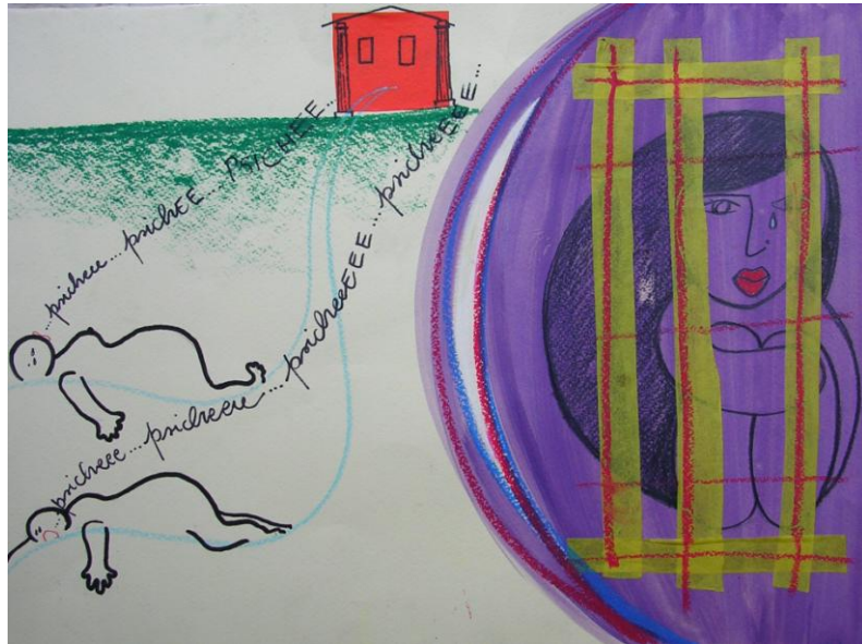
Fig. 6 – Le sorelle di Psiche sospinte nella reggia di Eros

parlo. Illuminato con una lucerna, scottato da una goccia d'olio bollente, Eros fugge via da una Psiche disperata. Il disegno (Fig. 10) sembra suggerire, con la luce che avvolge anche Psiche, un suo stesso venire alla luce e prendere coscienza.