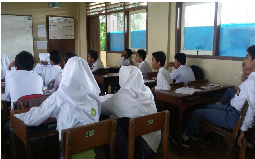
Peserta didik kelas XI MIPA 2 memperhatikan penjelasan guru.