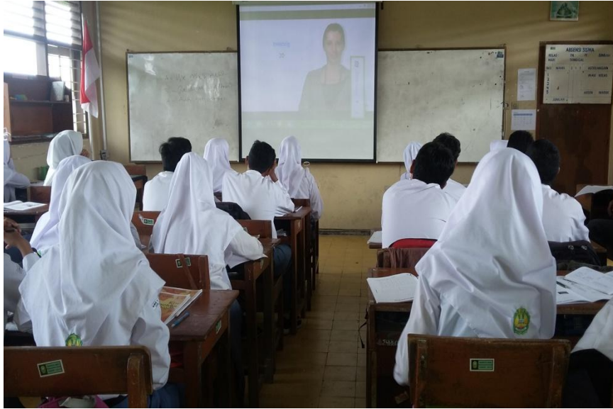
Peserta didik kelas X MIPA 4 memperhatikan media pembelajaran berupa video.