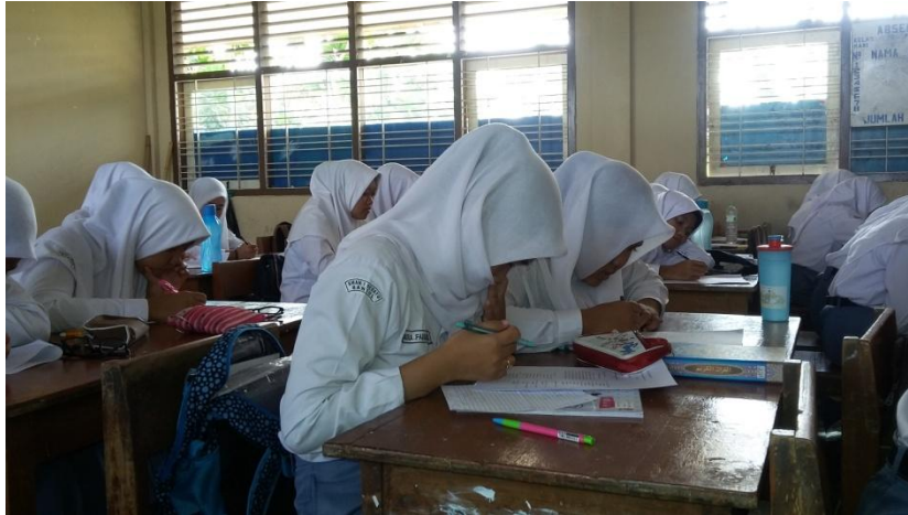
Peserta didik kelas XI MIPA 2 mengerjakan soal evaluasi.