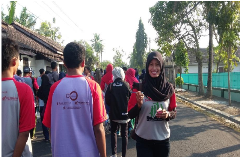
Jalan sehat dalam rangka HUT SMA 1 Sedayu.