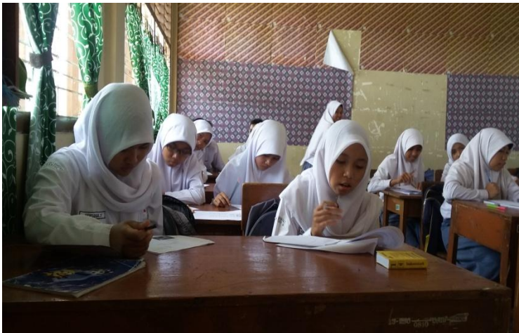
Peserta didik kelas XI MIPA 3 mengerjakan soal evaluasi setelah berdiskusi bersama.