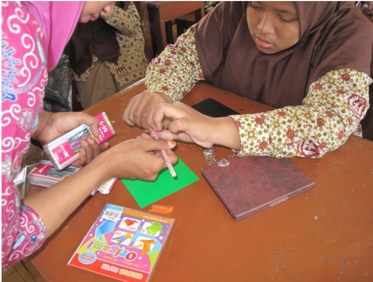
Membimbing kegiatan peserta didik KELAS X MIPA 4 dalam menuli surat.