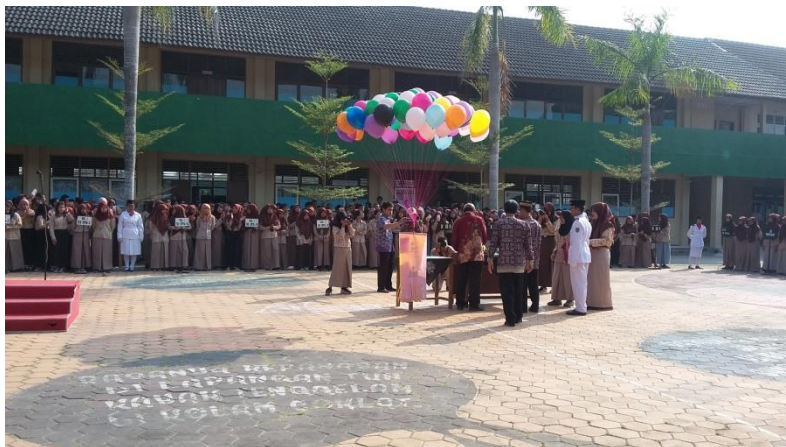
Upacara potong tumpeng HUT SMA 1 Sedayu