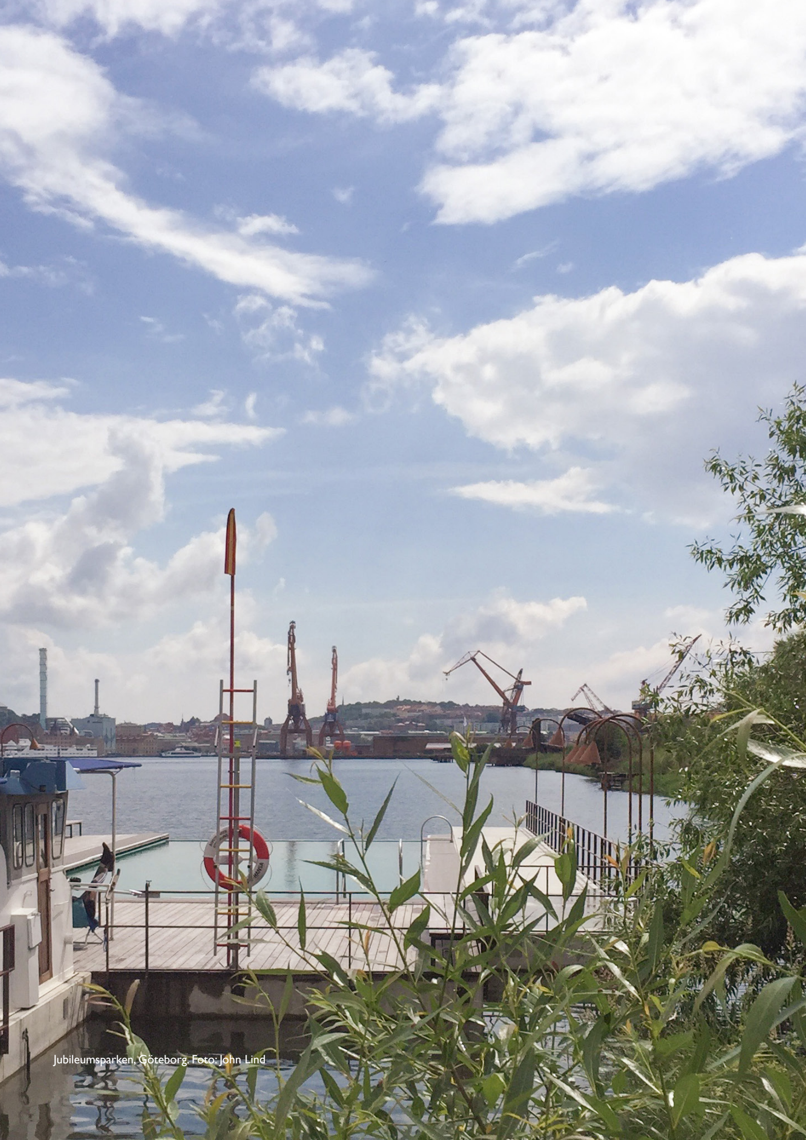
Jubileumsparken, Göteborg.