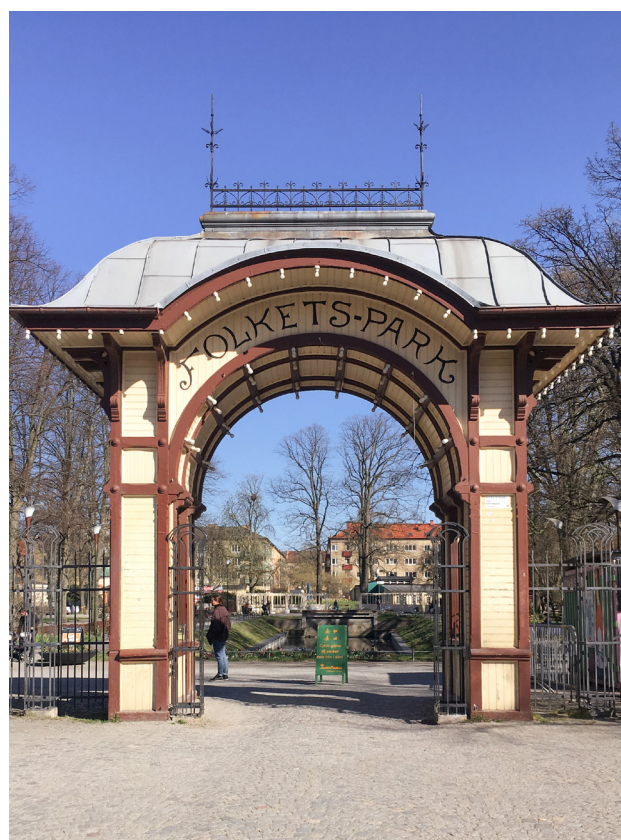
Pampig entré.

Under sommaren 2019 fanns följande element på ytan: skejtramper, utomhusbio/gamingyta, en multisportyta med utlåningsbod och Bluetooth-spelare , läktare, solstolar, stora gungor, bord och bänkar med grillplatser. Enligt Fredriksson var tanken att allt skulle vara temporärt och tas bort i september 2019, när de slutade med värdskapet, men att de valde att ha de flesta elementen på platsen eftersom ungdomar fortsatte att använda platsen på kvällar och helger. Vid observationen den 7/4 2020 hade ännu inte 2020 års element kommit på plats utan ytan bestod av de element som sparats på platsen över vintern. Vid observationen bestod således Vänskapstorget av tre delar: två skejtboardramper, en multisportplan samt en konstgräsyta.