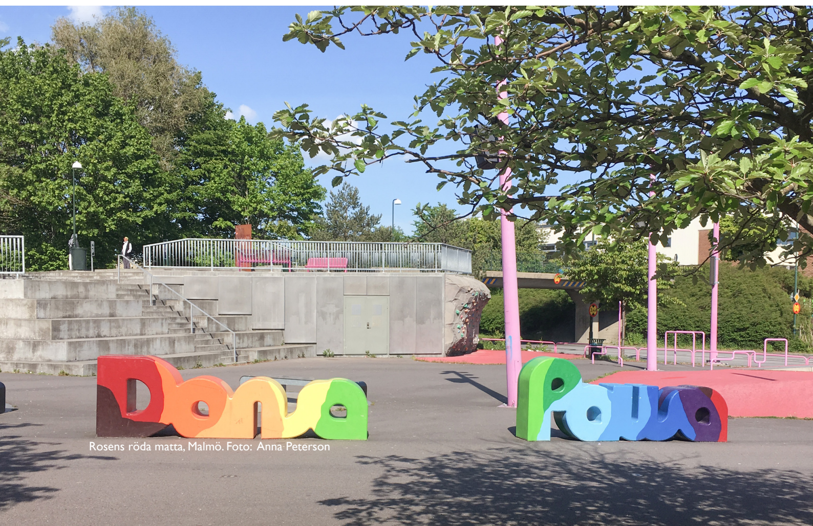
Rosens röda matta, Malmö.

engagemanget efter att ungdomarnas anställningsperiod tog slut fortsatte kommunen att arrangera aktiviteter på platsen tills den var klar. Björnson (2015, s. 127) menar att detta var ett sätt att använda ytan temporärt samt inarbeta funktionen som aktivitetsyta. Björnson sammanfattar (2015, s. 131) att arbetet med unga tjejer och medborgardialog var värdefullt på flera sätt. Det ledde till konkreta idéer för gestaltningen, ett intressant fullskaletest samt väckt intresse för tjejerna som deltog i projektet att vara med och utveckla staden. Björnsson pekar slutligen på att det är lätt att applådera och förespråka involvering av ungdomar i medborgardialoger. Hon menar att handlingsplaner är viktiga men att det handlar om att genomgående implementera delaktighet i hela processen. Det är en utmaning men det är vad som krävs för att uppnå delaktighet och jämställdhet i stadsplaneringen (Björnsson 2015, s. 131-132).