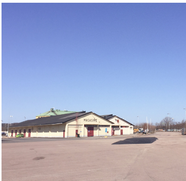
Bilder från ovan: Bussförbindelse till Frihamnen. Foto: John Lind Fiskare i Frihamnen. Foto: John Lind Magasinsbyggnad på Frihamnen. Foto: John Lind