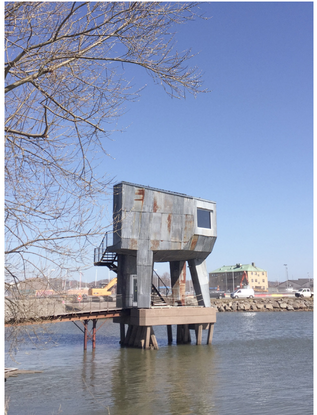
Svettekôrkan, Göteborg.

När Frihamnen utvecklas till en urban stadsdel riskerar den industriella karaktären att försvinna i området (Raumlabor 2015). Jubileumsparken utvecklas för att sammanfläta gamla strukturer med nya parkelement för att bevara platsens minne. Olika typer av material och byggnads-sätt har använts i skapandet av parken för att ge en industriell och vild känsla. Den vilda vegetationen som vuxit upp längst kajkanten har gallrats ur. Hamnbassängerna har sedan länge förlorat sin funktion eftersom området inte längre används som hamn (Raumlabor 2015). Poolen, bastun och stranden är ett sätt att skapa en ny funktion för hamnbassängerna. I den gröna delen förstärks den vilda känslan genom de växtval som gjorts. Elementen i den blå delen ger en stark industriell känsla som känns inspirerad av området. Svettekôrkan lyfter sig som en slags levande container från sin plats i hamnbassängen. De olika byggnaderna för omklädning är byggda i cortenstål vilket ytterligare förstärker den industriella känslan. Träspängerna som kopplar ihop de olika delarna ser ut som drivved som flutit i land. Liesegang (2020) berättar att de utgick från platsen när de byggde parken och att spängerna är en del av utformningen. De stora asfaltsytor som utgör den största delen av Frihamnen skapar en utsatt känsla. De olika elementen och vegetationen på platsen skapar mindre, intima rum där den exponerade känslan minskar.