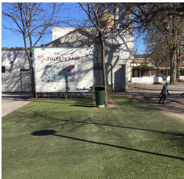
Bilder från ovan: Skejtboardsramperna. Foto: Anna Peterson Multibollplanen. Foto: Anna Peterson Konstgräsyta. Foto: Anna Peterson