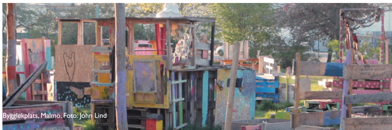
Byggglekplats, Malmö.