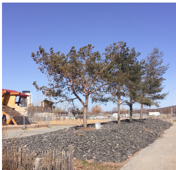
Bilder från ovan: Skejtboardramp. Foto: John Lind Pöl harbour. Foto: John Lind Tallplantering. Foto: John Lind