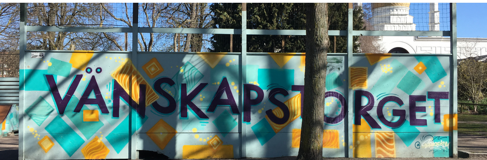
Vänskapstorget, Malmö.