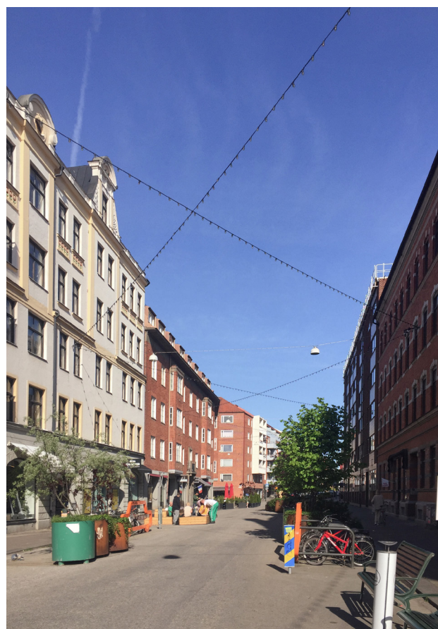
Sommargågata, Malmö.

Enligt Zimm (2016, s. 13) kan temporära platser på kort tid skapa nya mötesplatser och bidra till en större rörlighet i staden. Rörligheten bidrar till nya sociala möjligheter där invånarna lär känna sitt område och sina grannar. Ett nära samarbete mellan allmänheten, offentlighet och gestaltningskompetens kan bidra till projekt som förändrar både platser och aktiviteter i staden (Zimm 2016, s. 7). Bishop & Williams poängterar att temporärt användande inte ska ses som en experimentell prototyp för en framtida permanent användning utan att det har ett stort värde i sig. Temporära platser bidrar till att skapa spännande och intressanta stadsrum. Det är inte något som snabbt ska testas för att få det överstökad så att en permanent plats kan byggas (Bishop & Williams 2012, s. 215). De temporära platserna kan uppmärksamma tidigare oanvända platser eller ompröva dess syfte (Zimm 2016, s. 13).