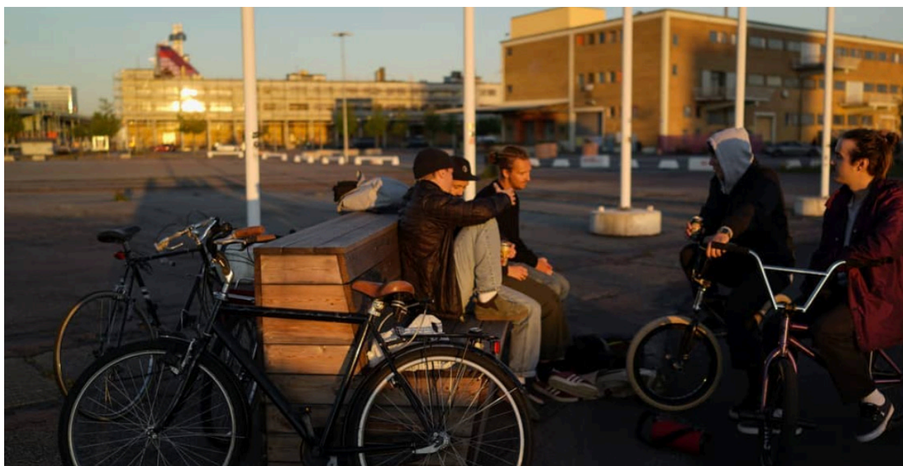
BMX-åkare och skejtare vid Rollerderbyplanen.

Den blåa delen är den mest populära i parken. Under varma sommardagar brukar poolen bli full och en kö bildas till den blåa delen. Bastun är det elementet som används mest året runt. Rollerderbybanan används idag till störst del av skejtare och BMX-cyklister som ställt dit olika objekt som de kör på. Dessa brukare använder ytan flitigt under de varmare delarna av året.