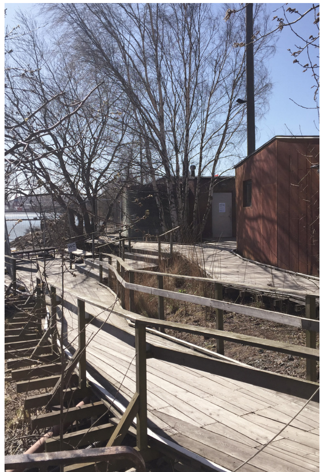
Jubileumsparken, Göteborg.