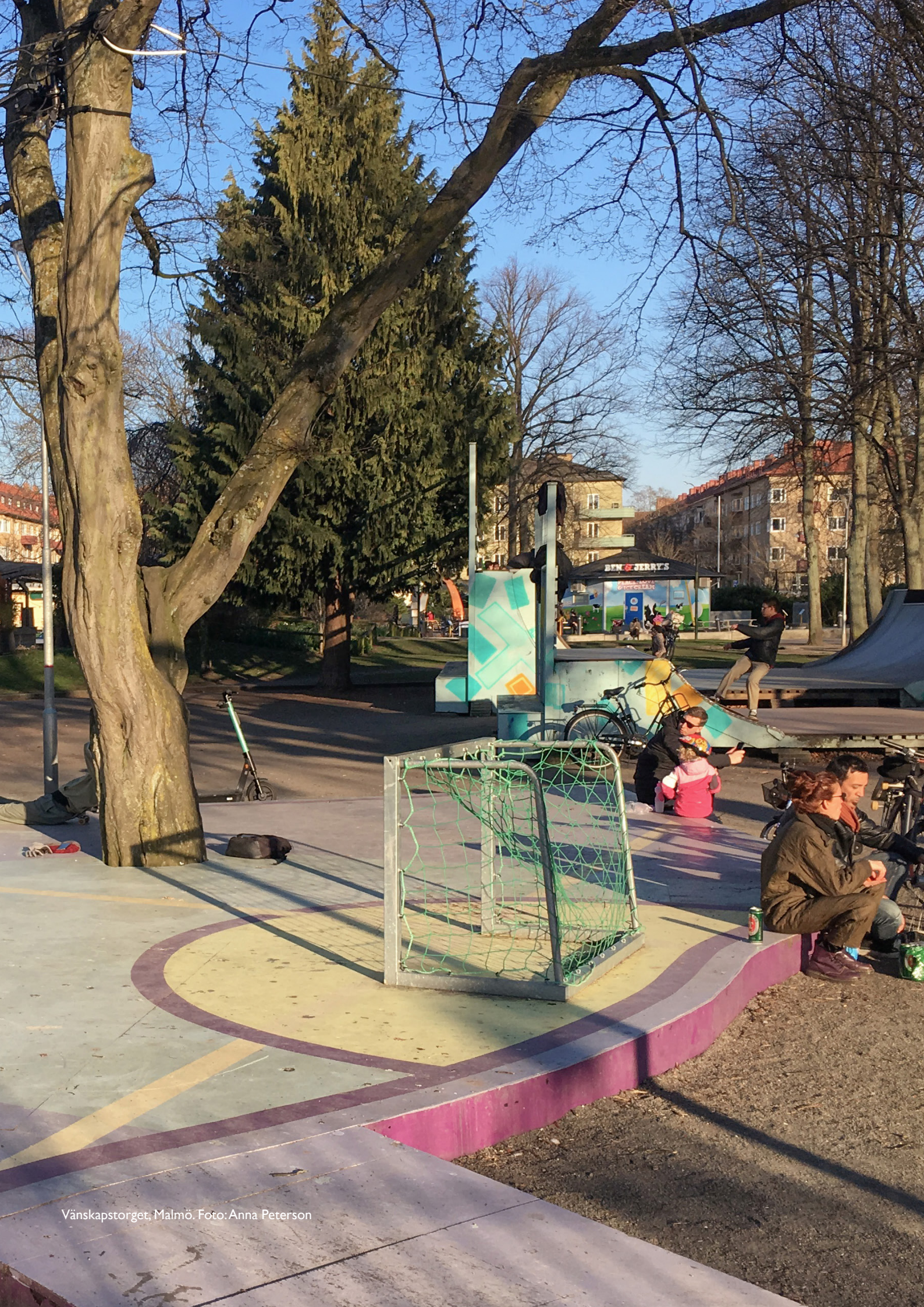
Vänskapstorget, Malmö.