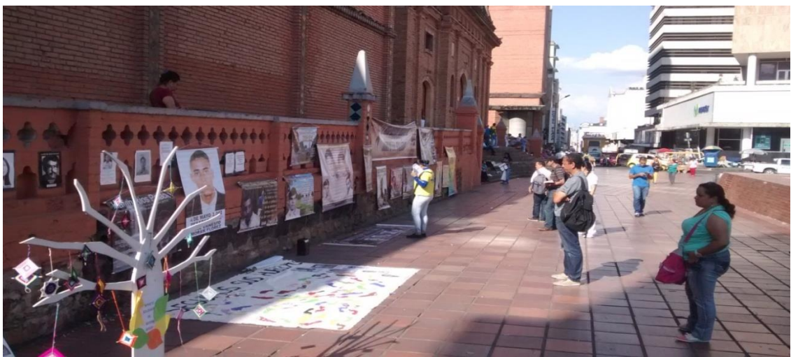
Foto: “El plantón” (La comunidad visualizando la información de las víctimas de desaparición forzada en Cali y el Valle) Trabajo de campo, 25 de Julio de 2014

“El plantón lo que pretende es, no solo que cada mes esté ese poco de gente ahí con los pendones, sino realizar una actividad visible, que significa contar quién es su familiar a una persona “x” pero con que esa persona solo la escuche es suficiente, es esa forma de hacer algo. El plantón es esa posibilidad de contarle a la ciudad qué pasa, por qué existen las desapariciones en Cali, que hay gente de carne y hueso que los está sufriendo, y que los desaparecidos no son el delincuente, la delincuente, o que si lo fuese no tienen por qué haberle desaparecido. Además, queremos que el plantón no sea una dinámica solo de los familiares, sino que también podamos lograr que la gente nos conozca, que se vaya volviendo un acto cultural o una obra que uno va a ver, porque eso hace también que las familias no se sienta solas y a medida que eso vaya creciendo puede que este tema vaya tomando más fuerza, en la medida de resultados hacia los que están desaparecidos” (Coordinadora Guagua, julio 9 de 2014).