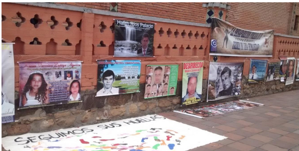
Foto "El Plantón" (Muestra la exhibición de fotografías ampliadas de personas desaparecidas y consignas con la exigencia de justicia y de lucha contra la impunidad) Trabajo de campo, 27 de Junio de 2014

En esta imagen se pueden observar los pendones que exhiben los familiares con las fotos de las personas desaparecidas, estas piezas publicitarias se han podido conseguir por medio de recursos propios de las familias y con el apoyo de la Fundación Guagua y La Galería de la Memoria Tiberio Fernández Mafla 19 , en los pendones se expone la foto del familiar, algunas leyendas, frases de los desaparecidos y de los familiares, denuncias y reclamos. Al realizar este evento en una de las plazas principales de la ciudad se resalta la cantidad de personas que observan, se acercan, preguntan y apoyan las actividades realizadas en cada evento. Se considera que es una acción que genera impacto y que además brinda a los familiares esa oportunidad de expresar su dolor, sus esperanzas y sus necesidades, lo cual es importante para ellos (Trabajo de campo, Julio 25 de 2014)