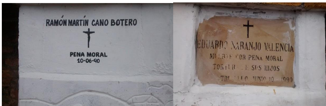
Foto: “Sepulcro de personas fallecidas a causas emocionales o “pena moral” (Trabajo de campo, 31 de mayo de 2014).

Por último es importante destacar la fuerza y resistencia que tienen los familiares de una persona desaparecida, lo cual es una característica que les permite seguir viviendo con la pérdida, sin embargo no todas las víctimas desarrollan tal fortaleza pues existen casos en los que los familiares de desaparecidos mueren a causa de la denominada “pena moral” o causas emocionales, que se refiere a las muertes por causas indirectas que se menciona en Informe del Grupo de Memoria Histórica, 2008 20 y que a causa de su incidencia ha sido catalogado dentro la evolución de las dimensiones y hechos violentos del caso Trujillo, ya que son muertes precedentes de la violencia perpetrada en el municipio.