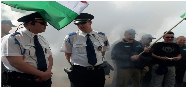
2. ábra: A rendőri képmás felhasználásával kapcsolatos eljárás során kifogásolt kép. Forrás: Dr. Schubauerné dr. Hargitai Veronika: Az alapjogi korlátozások egyes polgári jogi aspektusai, Alkotmányos alapjogi normák érvényesülése a rendőri képmás felhasználásának tükrében. 2019. december 10-ei előadásanyag

Összegzésként a BH 2018.9.248 alapján mutatta be, hogy a tüntetést biztosító rendőrök képmásának hozzájárulásuk nélkül, felismerhető módon való nyilvánosságra hozatala esetén a sajtószabadságnak a jelenkor eseményeiről, illetve a közügyekről való hiteles tájékoztatás alkotmányos jogának van primátusa a közszereplőnek nem minősülő rendőrök emberi méltóságából fakadó személyiségi jogával szemben. Annak ellenére, hogy a tételes jog nem teszi lehetővé annak megállapítását, hogy a közszereplők mellett más személyek esetében is jogszerű lehet a képmás (vagy hangfelvétel) érintett hozzájárulása nélkül történő nyilvánosságra hozatala.