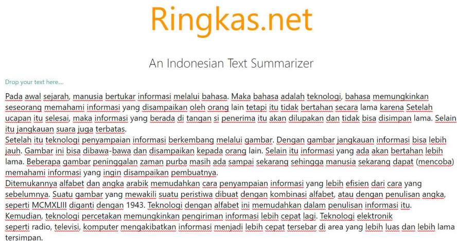
Gambar 2 Input teks untuk peringkasan

2. Selanjutnya, kita inputkan teks/artikel yng akan diringkaskan. Lalu inputkan juga jumlah kalimat yang dikehendaki dalam ringkasan.