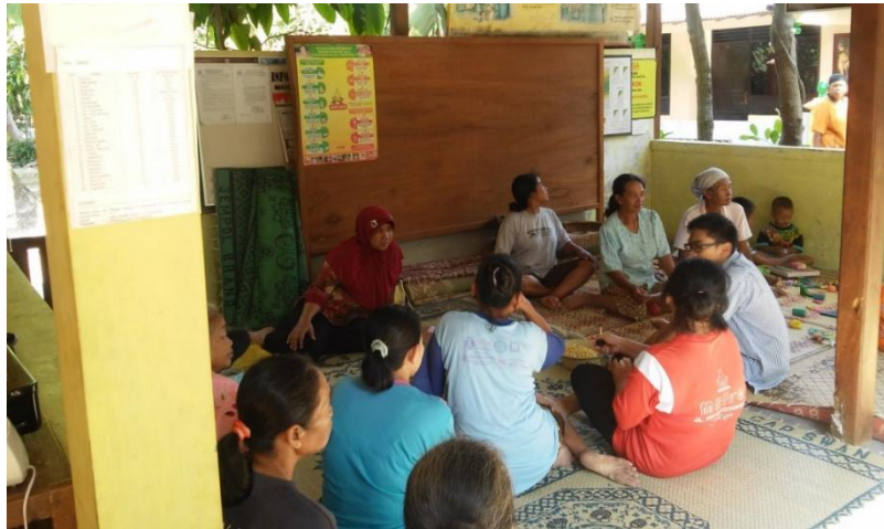
Suasana kegiatan Ibu-Ibu PKK sembari mendengarkan penjelasan Tata Cara Pembuatan Susu Kedelai (5/8).