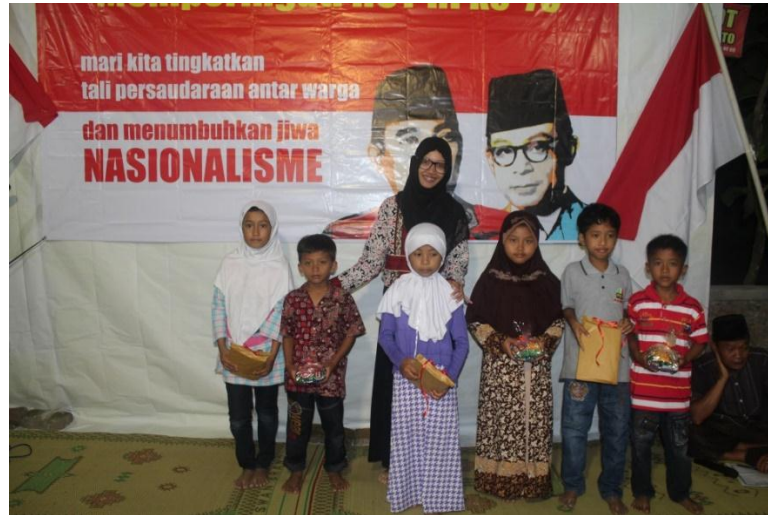
Penyerahan hadiah Lomba Anak-Anak pada Malam Tirakatan Kampung Srayu (16/8).