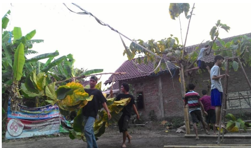
Kerja Bakti untuk membersihkan area lomba di Lapangan Voli RT 05 (7/8).