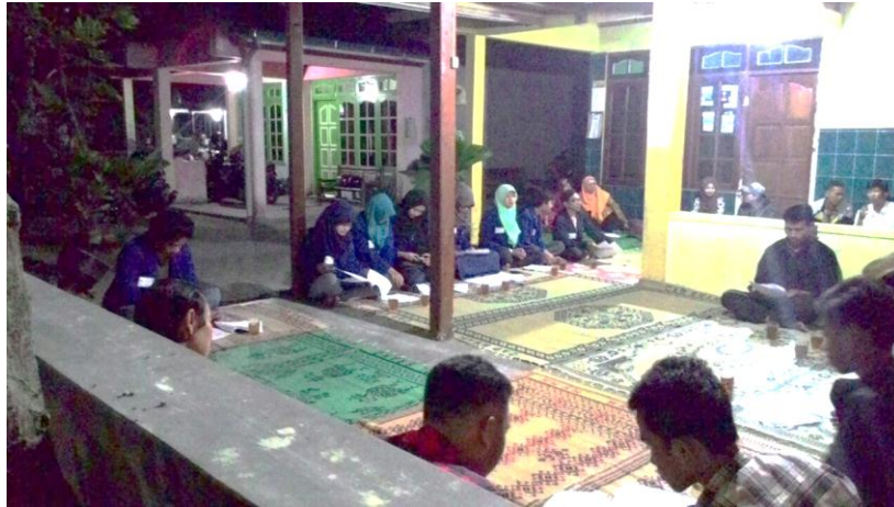
Sosialisasi Program Kerja KKN 1025 yang dihadiri oleh tokoh masyarakat, kader Posyandu, dan tokoh pemuda (3/8).