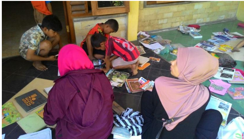
Proses Inventarisasi dan Pembersihan buku-buku yang ada di Taman Baca Masyarakat (3/8).