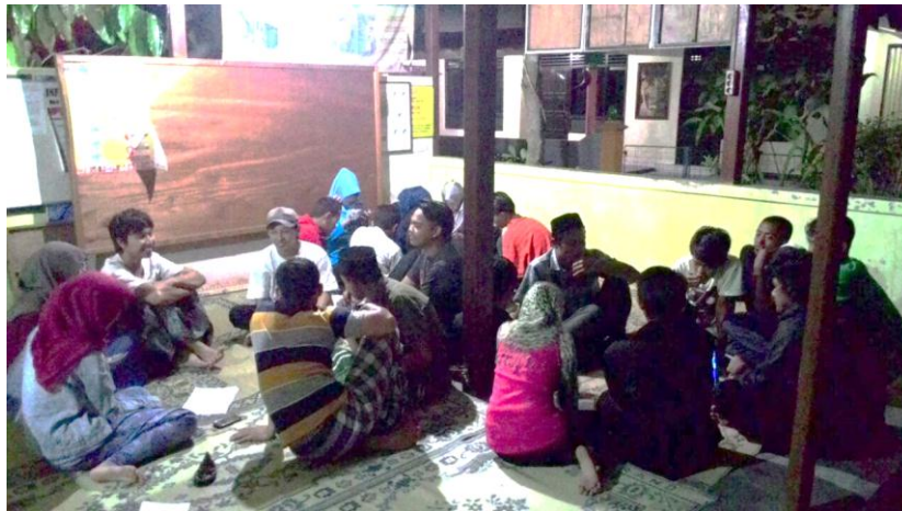
Pembahasan Rangkaian HUT Kemerdekaan RI ke-70 bersama Pemuda Kampung Srayu (5/8).