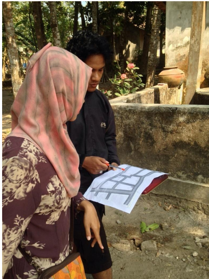
Mahasiswa membuat draf lokasi rumah-rumah untuk denah pedukuhan Beran (26/8).