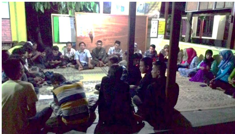
Rapat Pemuda Kampung Srayu di Dukuh Beran untuk membahas Rangkaian HUT Kemerdekaan (5/8).