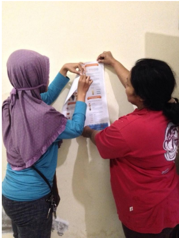
Proses sosialisasi dan penempelan poster tentang manfaat minum air bagi kesehatan. Sosialisasi dilakukan dari rumah ke rumah di semua RT Pedukuhan Beran (24/8).