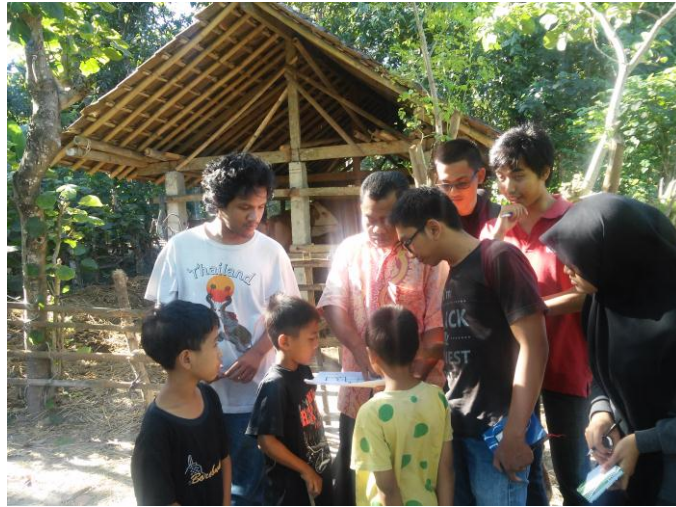
Mahasiswa bersama Dukuh Beran mengecek batas-batas pedukuhan (1/8).