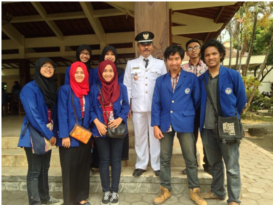
Foto bersama Lurah Desa Canden se usai upacara bendera 17 Agustus di Kecamatan Jetis (17/8).