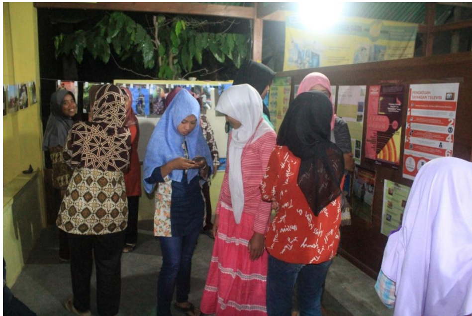
Masyarakat melihat-lihat pameran foto hasil kegiatan KKN dan poster-poster program yang telah selesai dilaksanakan (30/8).