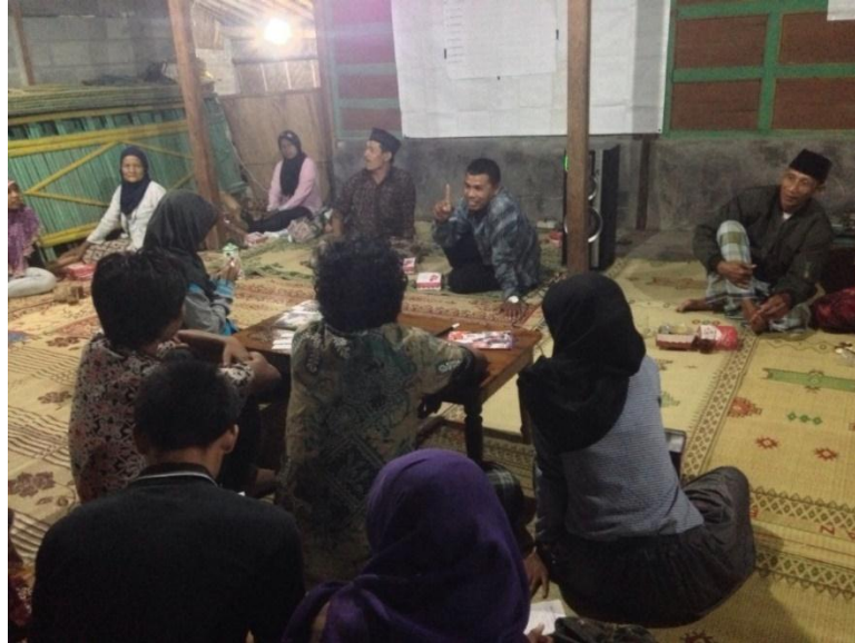
Mahasiswa KKN berperan sebagai panitia pemilihan RT 06 (29/8).