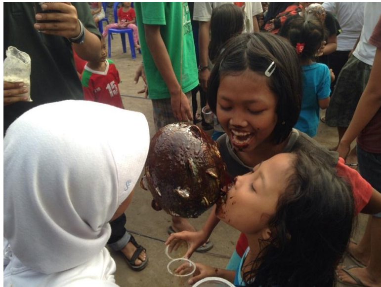
Salah satu lomba anak-anak yang diadakan Pemuda Kampung Srayu bekerja sama dengan Tim KKN UNY 1025 (9/8).