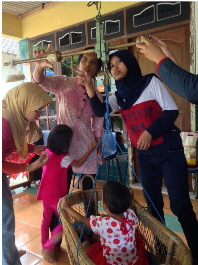
Ibu-Ibu Posyandu dibantu oleh mahasiswa mengukur berat badan Balita Pedukuhan Beran (15/8).