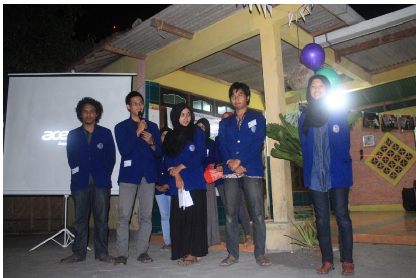
Prosesi pamit dan penyampaian kesan-kesan dari mahasiswa KKN pada festival Pamit KKN 1025 (30/8).