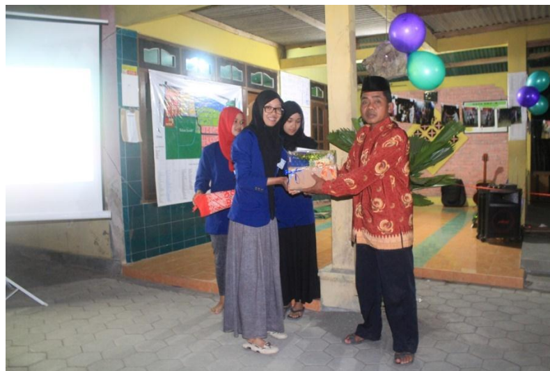
Penyerahan sumbangan buku untuk Taman Baca pada malam perpisahan (30/8).