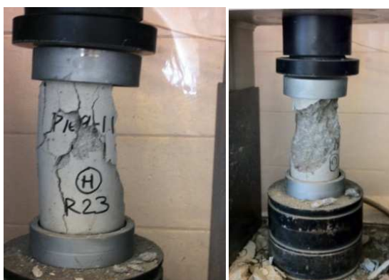
Figura I.- Probetas luego de ser ensayadas

La Figura I muestra fotografías representativas de las probetas una vez ensayadas las mismas a compresión.