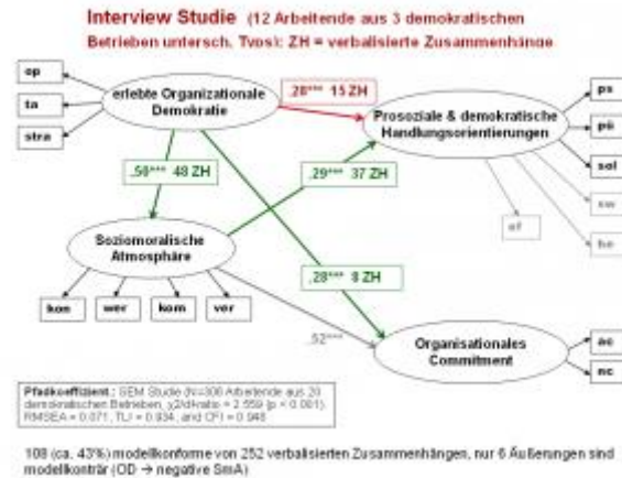
Abbildung 3. Resultate der Interviewstudie (qualitative Inhaltsanalyse) im Vergleich zur Fragebogenstudie (SEM)

Die Durchsicht bestätigt das bereits Berichtete: Es finden sich kaum Interviewzitate, die eine negativ ausgeprägte Beziehung zwischen den drei Zielkonstrukten behaupten. In der Mehrzahl der kodierten Interviewpassagen (nämlich in 80 von 102 berichteten Zusammenhängen) wird dieselbe Wirkrichtung zwischen jeweils zwei Konstrukten angenommen, wie sie auch unser konzeptuelles Rahmenmodell hypostasiert.