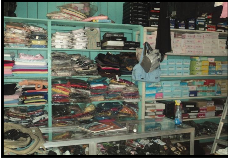
Fotografía 5. Negocio de ropa y calzado.