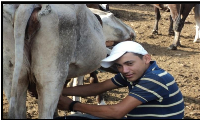
Fotografía 2. Realización del ordeño en una unidad productiva de Santa Rita.