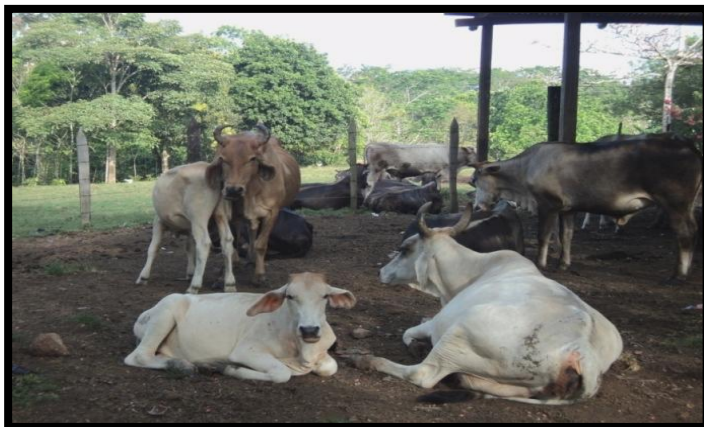
Fotografía 1. Ganado bovino en una unidad productiva de la comunidad de Santa Rita.