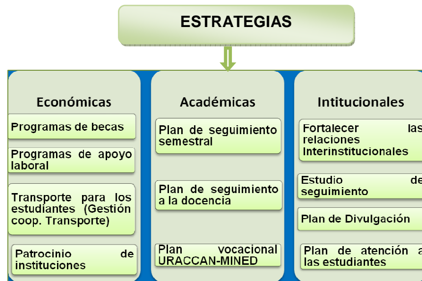
Esquema No 3. Sugerencias de estrategias para disminuir la deserción

académicas e institucionales, se muestran en el siguiente gráfico.