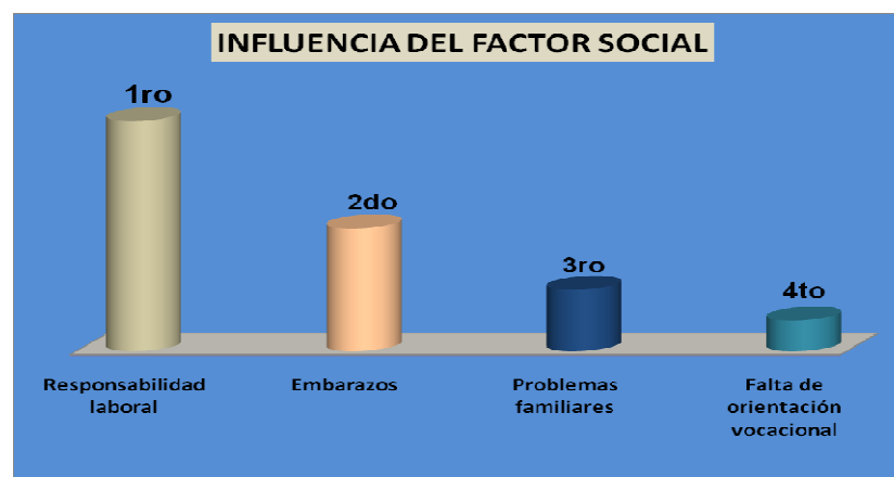
Grafico No 2; Influencia del factor social en la deserción

En el aspecto social se encontró como factores influyentes, en primer lugar, la responsabilidad laboral, seguida por los embarazos en las jóvenes, los problemas familiares y por último la falta de orientación vocacional, tal como lo muestra el gráfico siguiente.