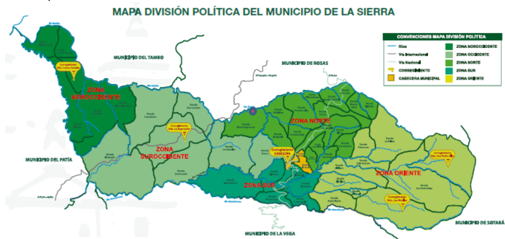
Figura 9. Municipio de La Sierra Cauca