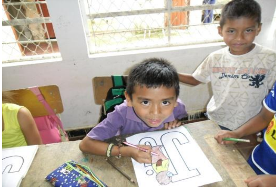
Figura 15. Niños narrando cuentos