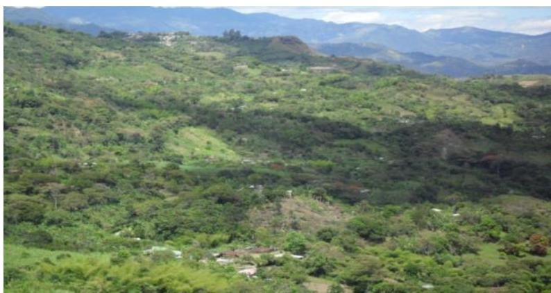
Figura 8. Vereda Frontino Bajo año 2011

La vereda Frontino Bajo se encuentra situada al noroccidente de la cabecera municipal del municipio de La Sierra Cauca y a una distancia de dos kilómetros y medio. Límites: Al norte con Frontino Alto, al oriente con la vereda La Cuchilla, al sur con la vereda el Guindal y al occidente con la vereda Zabaletas.