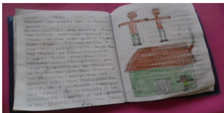
Figura 33. Cuaderno del estudiante Esteban Santiago Pastas