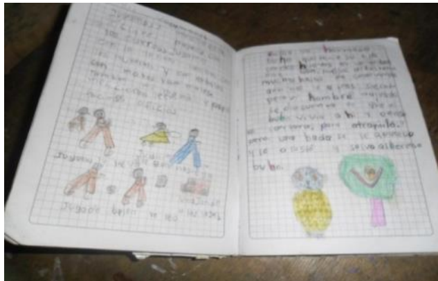
Figura 32. Cuaderno del estudiante Robinson Piamba