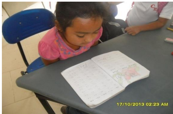
Figura 3. Demostración de que los docentes trabajan con el método silábico

reflexionen sobre el significado de lo que leen y puedan valorarlo y al mismo tiempo criticarlo, que disfruten de la lectura y formen sus propios criterios de preferencia y de gusto estético". Es necesario reconocer que la vida de hoy también viene proyectando niños con mayor tendencia a la comprensión centrada en la respuesta a la indagación de la manera que el método silábico ahora es más un apoyo complementario que un recurso para apropiación de la lectura comprensiva. En ese sentido la consolidación del aprendizaje de la lectura y escritura exige el fortalecimiento de la confianza y seguridad de los niños, tarea que debemos de asumir los docentes con todo el sentido de responsabilidad.