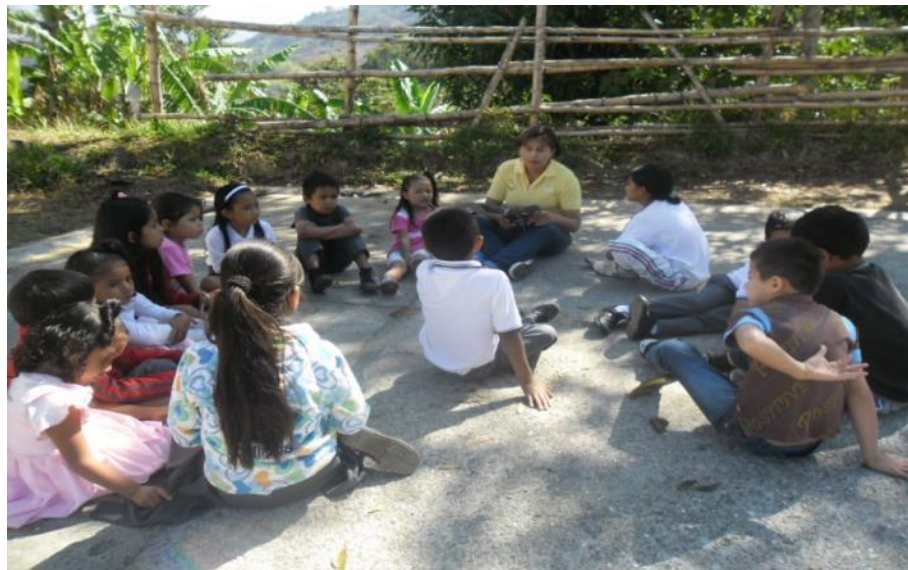
Figura 31. Lectura de acuerdo con los niños

Todo esto se hace con el fin de que los estudiantes se motiven a escuchar y traten de entender las diferentes situaciones manifiestas en el texto. Recreando su imaginación y sus pensamientos. En este sentido el cuento se convierte en textos que actúan no solo como enlaces comunicativos entre los niños sino también como uno de los medios privilegiados para acceder a la escritura. A medida que pase el tiempo los niños empezaran a organizar sus relatos mediante dibujos, tratando de seguir una secuencia coherente a la del texto escuchado.