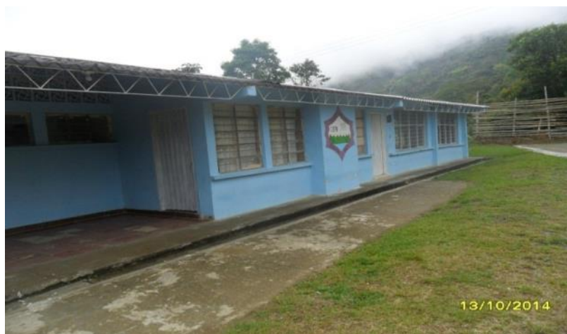
Figura 10. Centro Educativo Frontino Bajo