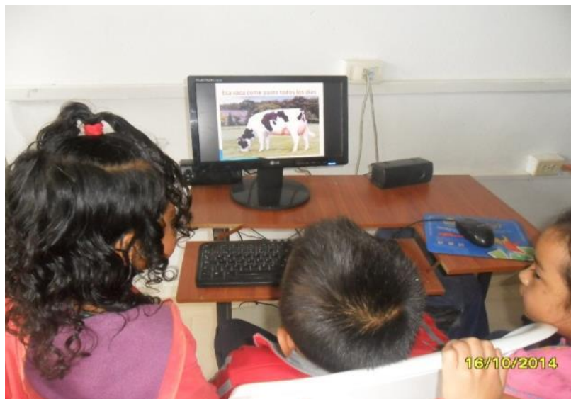
Figura 16. Interactuando con las TIC