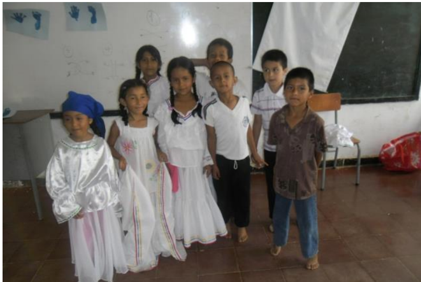
Figura 12. Actividades con los niños.

(Seminario de lectura y escritura según Ana Teberosky)