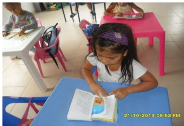
Figura 29. Estudiantes de transición

Los siguientes son estudiantes de transición.