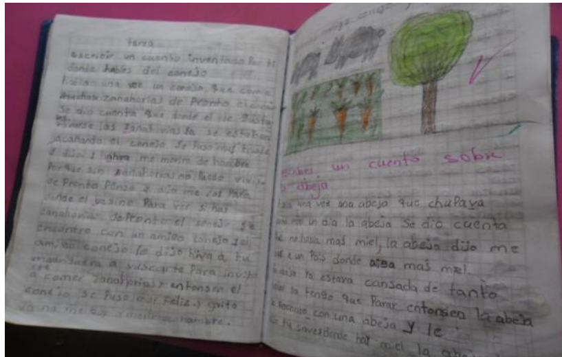
Figura 20. Trabajos de los niños(as)

De ahí la importancia de iniciar el proceso de la lectura y escritura desde contextos significativos próximos a la experiencia del estudiante, sin desconocer las diferentes formas de interrelación del niño consigo mismo y con su entorno.