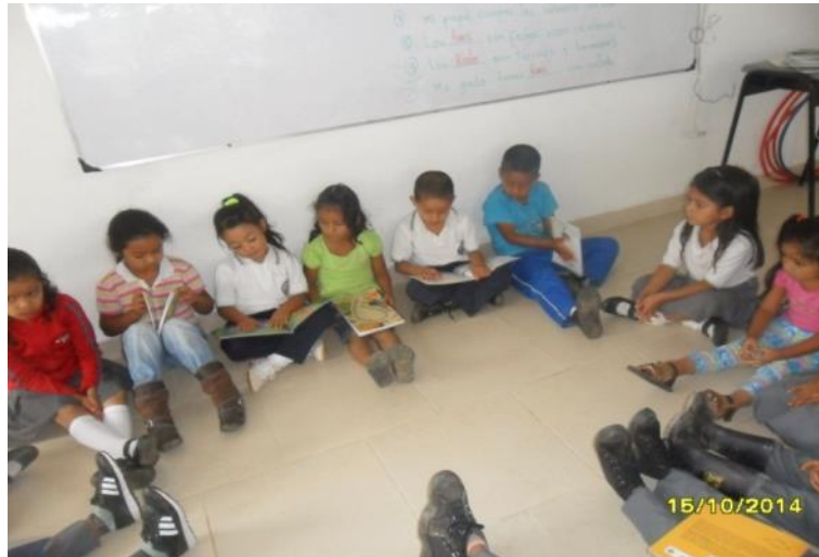
Figura 28. Estudiantes del grado transición, primero y segundo practicando lectura año 2011