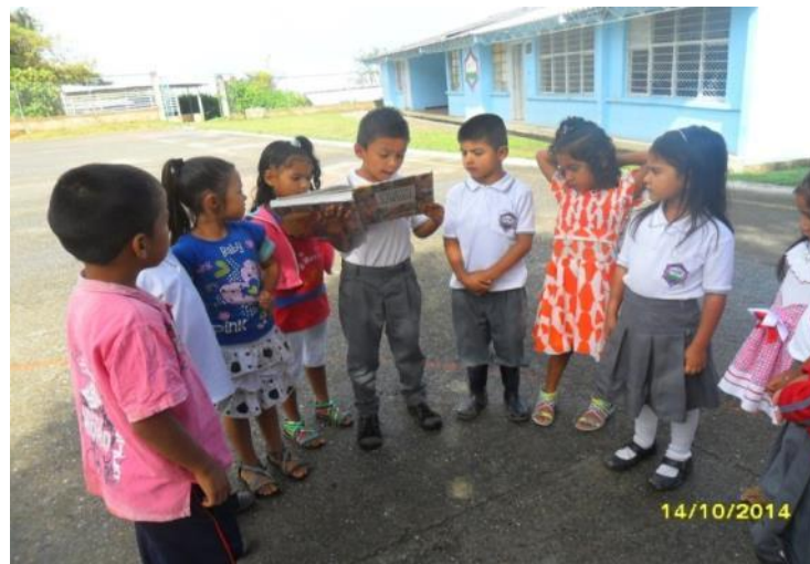
Figura 11. Niños(as) del Centro Educativo Frontino Bajo

20 octubre 2013