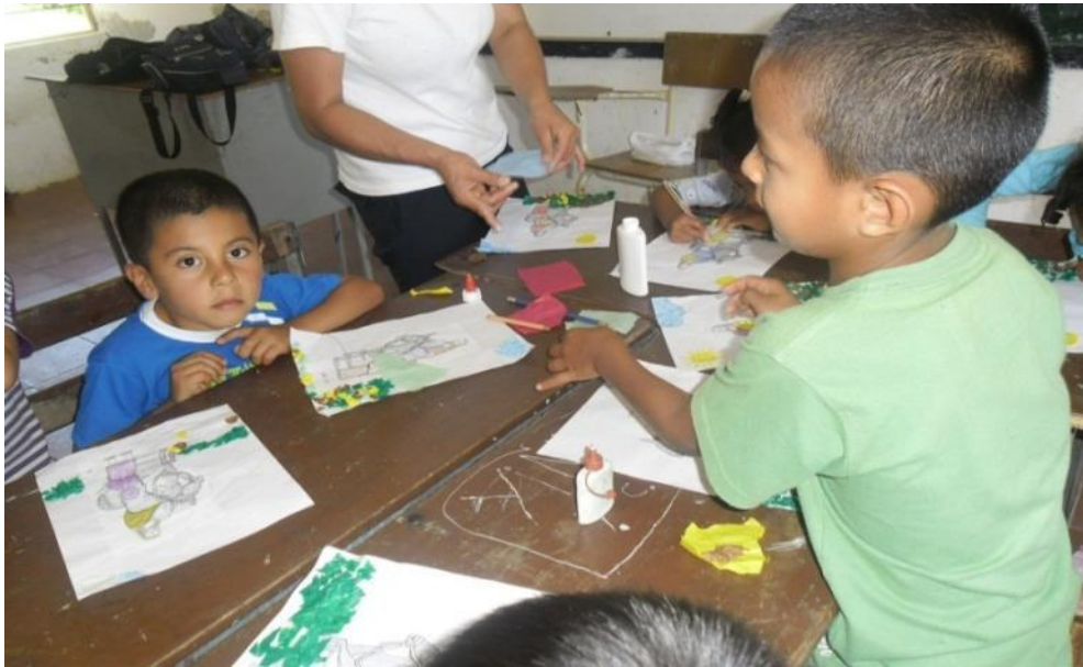
Figura 13. Niños Pintando

fija muy bien sus ojos, el sonido del agua, sus sentidos están continuamente en un actuar. Con estas experiencias y lo que desarrollan en su entorno social aprenderán más sobre su mundo lo cual ayuda al aprendizaje.