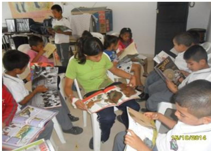
Figura 7. Estudiantes de todos los grados motivados a la lectura en momentos de descanso

Son dos actividades cognitivas donde además intervienen la afectividad, las relaciones sociales y culturales de la persona. Por ello los textos o libros deben estar al alcance de niños, niñas y adolescentes; cada texto debe recoger los intereses, necesidades y expectativas de cada persona para despertar el goce en la lectura de acuerdo a su edad y a su nivel cultural.