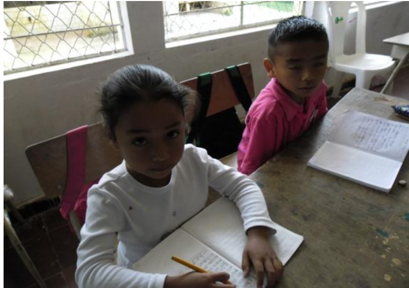
Figura 14. Estudiantes escribiendo oraciones

casos, los estudiantes trabajan palabras con frases cortas, también con oraciones textos completos y significativos.