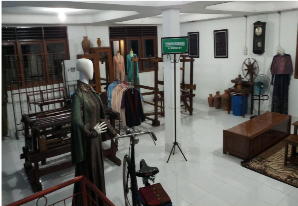
Gambar 1. Galeri Tenun Kubang H.Ridwan By

melayani pasar antar kota dan antar pulau bahkan sudah meluas ke pasar luar negeri seperti Malaysia. Adapun rata-rata jumlah penjualan yang dihasilkan oleh tenun Kubang H.Ridwan By pada tahun 2016 sampai dengan 2019 berkisar antara Rp. 300.000.000,- hingga Rp.500.000.000,- per tahun. Namun Pada awal tahun 2020 penjualan menurun drastis dampak pandemic Covid-19.