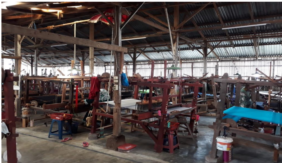
Gambar 2. Ruang produksi Usaha Tenun Kubang H.Ridwan By

Masalah yang dihadapi usaha Tenun Kubang H.Ridwan By salah satunya lambatnya proses produksi yang diakibatkan lambatnya proses desain motif. Hal ini