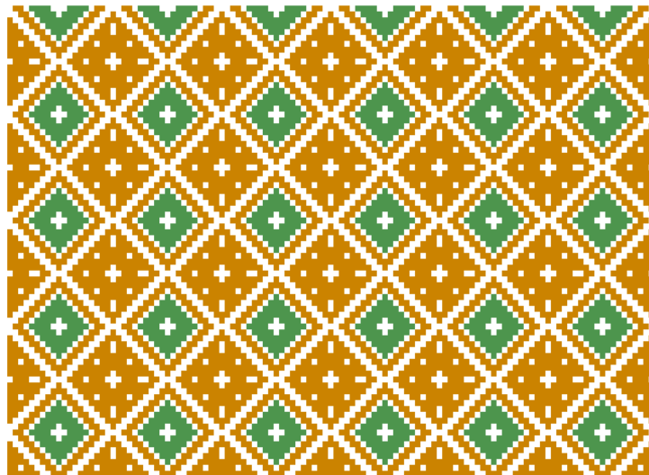
Gambar 5 Saik Galamai Baisi

Motif-motif hasil desain seperti Gambar 5 berikut ini: