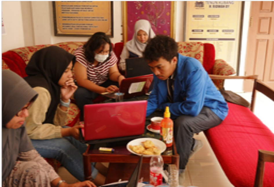
Gambar 4. Suasana Pelatihan Desain Digital

Motif-motif hasil desain seperti Gambar 5 berikut ini: