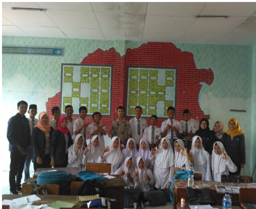
Gambar 2 Foto Bersama Siswa Man Negeri 1 Indramayu dan Kerjasama dengan Mahasiswa

Berdasarkan Gambar 2 dimana kegiatan ini dilakukan dengan adanya Kerjasama melibatkan mahasiswa program studi kesehatan masyarakat. Hal ini dilakukan agar pelaksanaan ini dapat berjalan lancar. Setelah kegiatan ini dilakukan bahwa dari hasil pengukuran IMT bahwa terdapat 13 siswa kategori overweight.