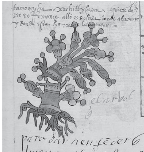
Figura 1. El árbol quebrado de Tamoanchan. Códice telleriano-remensis , fol. 13r.

El nombre mediante el cual es referido el lugar, significativo verbal esculpido en la dimensión sonora de una lengua, tiene un valor propio, más allá del significado que encierra. Aspectos determinantes del origen podrían estar contenidos tanto en las sílabas que lo componen, como en el semantismo difuso de la palabra y, eventualmente, en su etimología. El nombre de una cosa es “el sonido producido por la acción de las fuerzas movedizas que lo constituyen”, 3 escribió Avalon. Estas fuerzas movedizas remiten al soplo, a la dicción, al significado y, más generalmente, al espíritu.