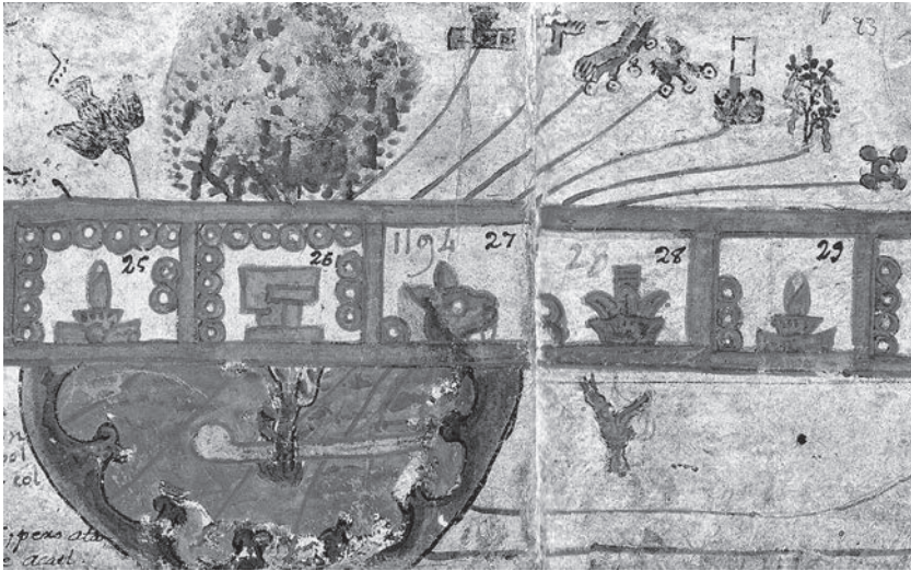
Figura 6. "El árbol florido enhiesto en la cueva de Chicomoztoc", Códice mexicanus , láminas XXII y XXIII

de un tronco original. La palabra náhuatl para romper o quebrar ( tlapani ) se encuentra también en contextos genealógicos de linaje. En efecto, tlapanca , variante sustantiva del verbo tlapani , designa al hijo de noble nacimiento, de noble linaje. En el caso aducido de la separación de los pueblos ocurrida en el Tamoanchan de la Huasteca, el linaje de los aztecas/mexicas se habría desprendido del tronco común de los pueblos con los que se formaban este pequeño mundo ( cemanahuatontli ). En una imagen del Códice mexicanus se observa un árbol florido enhiesto en la cueva de Chicomóztoc (figura 6) de la que salieron los pueblos migrantes y se separaron. En la imagen figura un colibrí que desciende ( temoa ), por lo que dicho lugar podría también representar Tamoanchan. En el Códice Boturini , el texto pictográfico que alude a la separación de los aztecas de los demás pueblos en Cuáhuatl Itzintla muestra asimismo un árbol quebrado que podría aludir, ideográficamente, a Tamoanchan (figura 4).