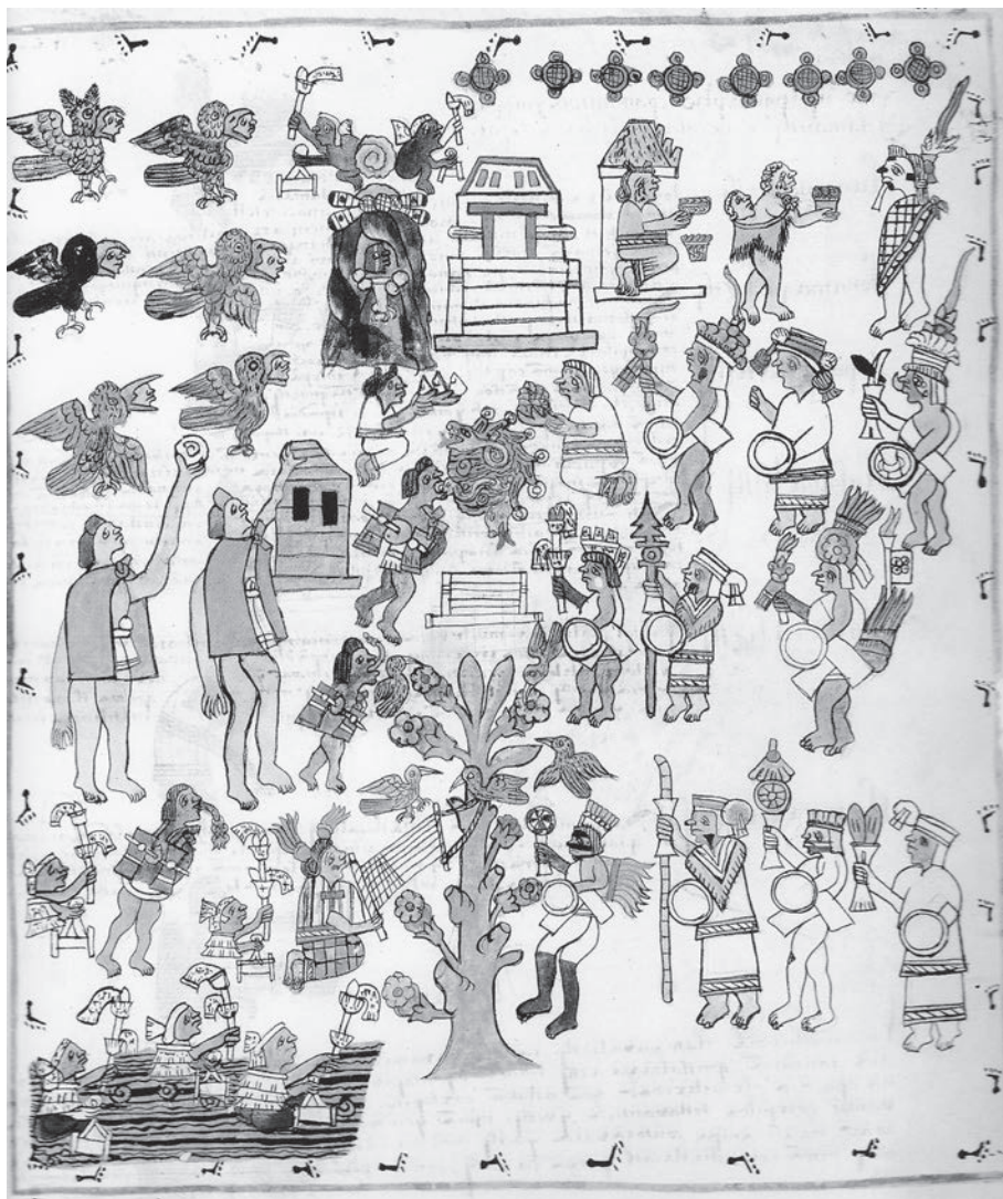
Figura 2. Xochicuauhtli. El árbol florido de Tamoanchan en la fiesta Atamalqualiztli. Códice matritense del Palacio Real de Madrid, fol. 254r