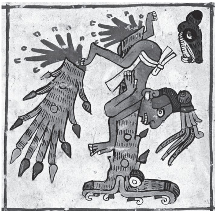
Figura 5. El árbol quebrado de Tamoanchan, Códice Borgia , lámina 24