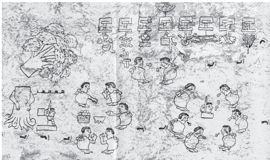
Figura 4. El árbol quebrado en Cuáhuítl itzintla. Códice Boturini , lámina III