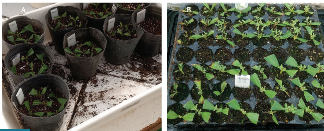
Figura 5. A. Estacas semileñosas de la variedad “TAWA INTA” dispuestas para su enraizamiento en maceta. B. Estacas del quimiotipo “252” y la variedad “TAWA INTA” a 10 días de enraizamiento en plugs bajo campana (b).

Se probó utilizando 1 medio plug de 128 alveolos (56 alveolos) con sustrato de enraizamiento (Tabaco-Terrafertil®) dentro de bandejas de plástico transparente a modo de campana. La realización en IGEAF y AMBA no dio resultado por ataque de hongos y excesivo calor. Se está realizando otra prueba en el invernáculo de Biotecnología, donde ya se ha obtenido más del 95 % de enraizamiento y supervivencia de estacas utilizando macetas plásticas (5 estacas/maceta) cubiertas por bolsas de polietileno (Figura 5). En todos los casos se utilizó segmentos de tallo semileñoso con 1 o 2 nudos de los genotipos 252 y TAWA INTA. La inducción de raíces se realizó utilizando IBA 3000 ppm en polvo.