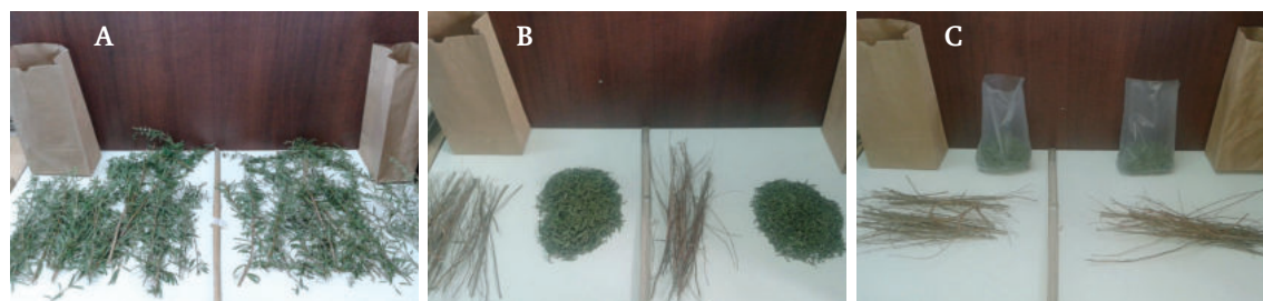
Figura 4. Fraccionamiento del material (tallos y hoja+flor) con 7 días de oreado.

La cosecha de la variedad TAWA INTA se llevó a cabo a principios de abril del 2017. Si bien las plantas presentaron floración despereja (50 % de plantas florecidas aprox.) se decidió no retrasar más la cosecha por la aproximación de los días fríos. Se cosecharon 12 plantas al azar (igual n que las 252 cosechadas anteriormente) exceptuando las plantas que fueron atacadas por hormigas. Las plantas presentaron un peso fresco promedio de 110 g. Se las dejó orear y a la semana se separaron las fracciones (Figura 4). El peso oreado total fue de 50 g, el de hoja+flor de 22,64 g y el de tallo de 27,45 g. La relación hoja+flor/tallo fue de 0,84 y la pérdida de agua fue del 54,69 %.