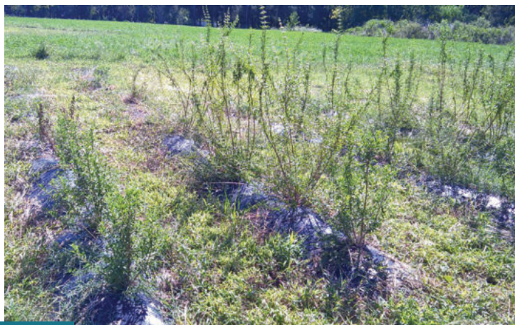
Figura 2. Ensayo de Incayuyo realizado en el AMBA (Bs. As.) a 5 meses de la implantación.

En los primeros estadios los genotipos no evidenciaron diferencias en el crecimiento. Al 16/2/17 el quimiotipo 252 se encontraba en prefloración, mientras que en la variedad TAWA INTA la floración se retrasó entre 3 y 4 semanas (Figura 2). Este retardo en el desarrollo también se observó en el menor crecimiento de las plantas de TAWA INTA con respecto al quimiotipo 252, registrándose diferencias significativas ( p < 0,05 ), tanto en la menor altura y el diámetro de la mata, como en el número de ramas (Figura 3).