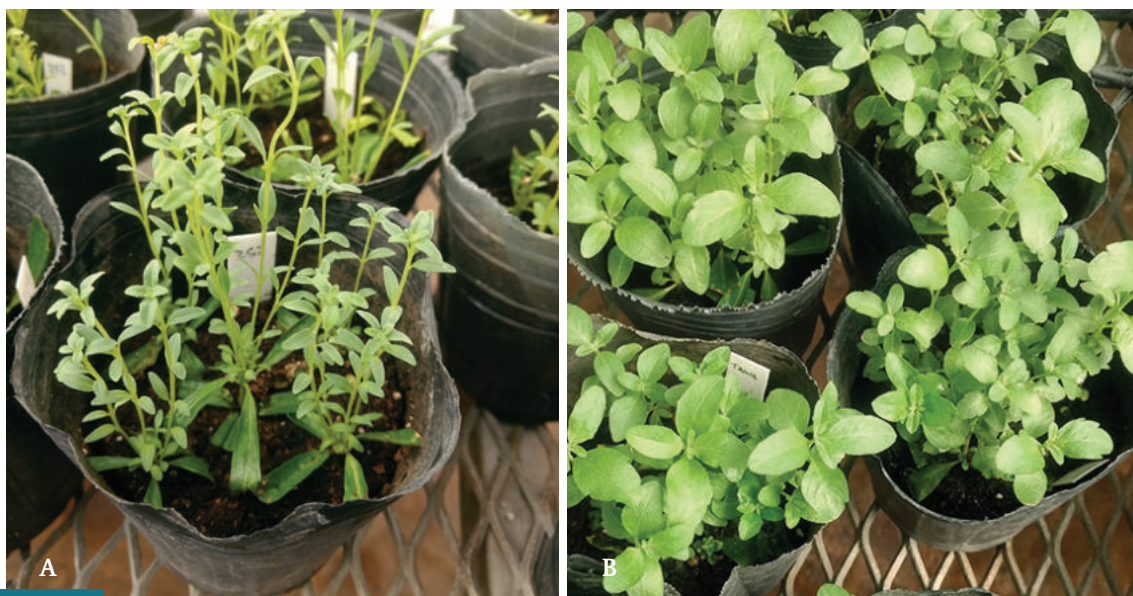
Figura 6. A. Estacas de incayuyo: quimiotipo “252” y B. variedad “TAWA INTA”, a 30 días de enraizamiento en maceta.

Se implementará un diseño con 3 repeticiones para cada localidad, a determinar. La unidad muestral estará conformada por 9 individuos como mínimo, más el borde. Para el genotipo “252” se prevé mantener el mismo marco de implantación, mientras que el “TAWA INTA” se implantará a una distancia de 0,7 m entre hileras.