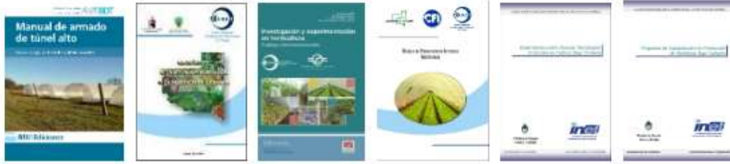
Figura 4. Publicaciones de acciones, resultados y libros

bioinsumos y ahorro en el uso de aguas de riego con más de 30 trabajos de investigación presentados en Congresos y Jornadas..