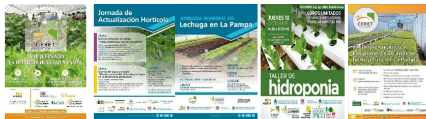
Figura 2. Panfletos o invitaciones a las Jornadas organizadas por el API

técnicos y público en general con una concurrencia promedio de 200 asistentes. El API lleva desarrolladas unas 40 jornadas en sus instalaciones.