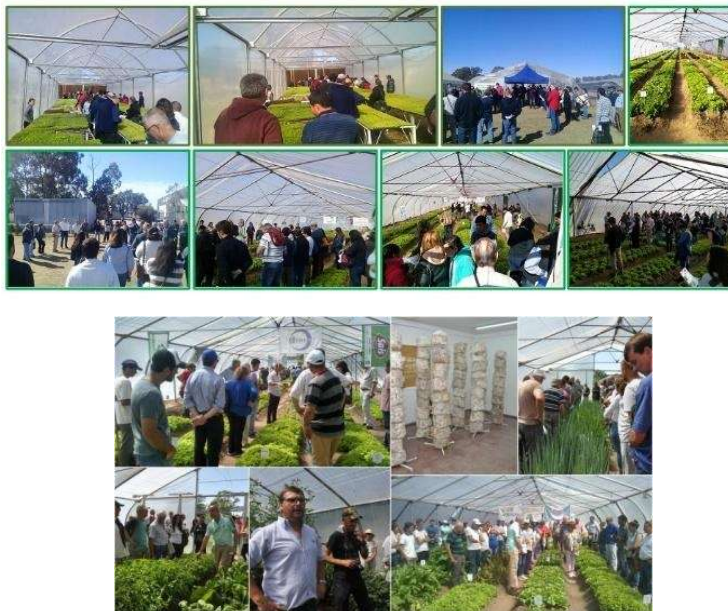
Figura 3. Fotos recopiladas en las distintas jornadas realizadas en el API