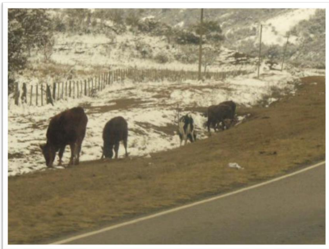
Foto 1: Vacunos pastando en el perilago Campo Alegre (tierras fiscales).