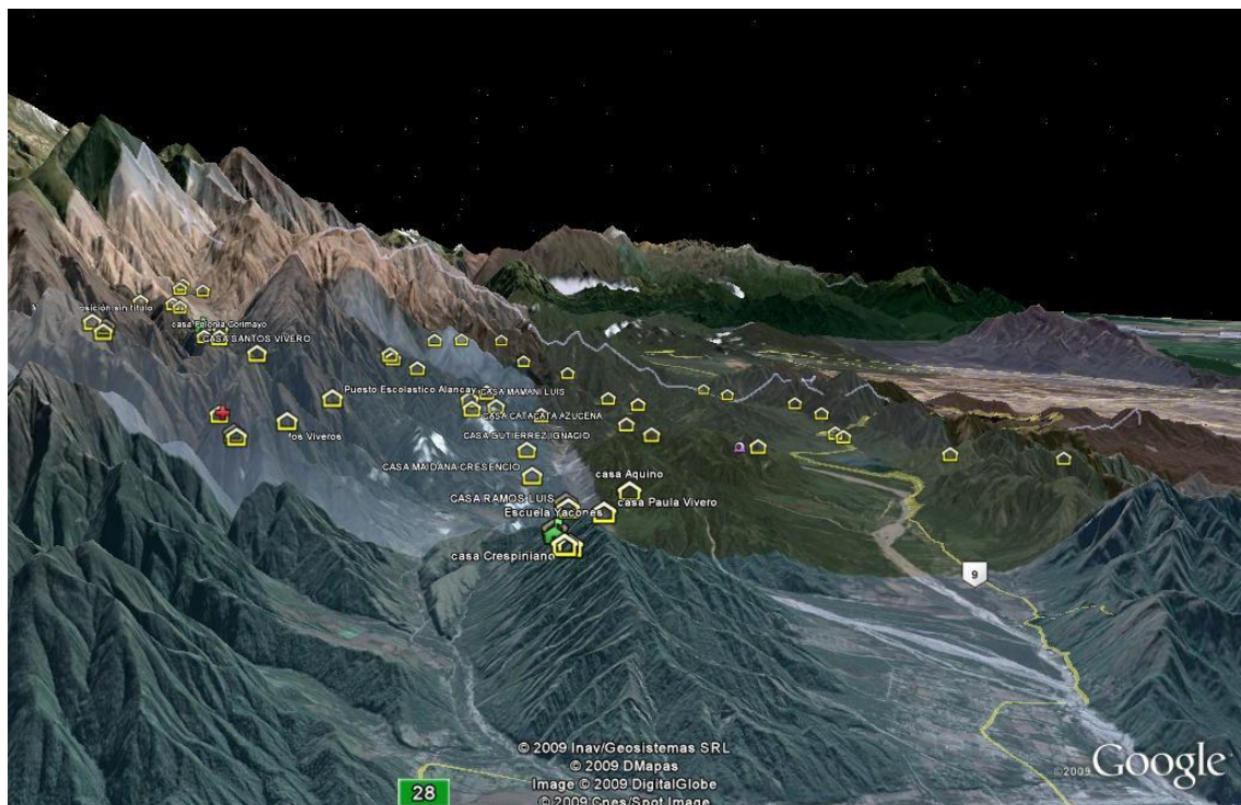
Figura 2: Ubicación de las viviendas de los ppp en zonas altas de La Caldera

Fuente: Elaboración realizada por el equipo de sanidad del Hospital Bustamante de La Caldera. 23 de Julio de 2010.