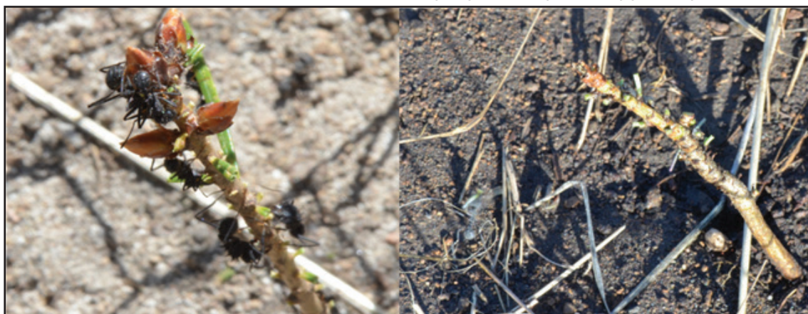
Figura 2: Obreras de A. lobicornis forrajeando plántulas de pino Oregon ( Pseudotsuga menziesii ) en Patagonia. Luego de unos minutos las plántulas fueron defoliadas completamente.

En Patagonia, el problema de la herbivoría por las hormigas cortadoras es de menor magnitud que en el noreste de la Argentina, debido probablemente a que las superficies forestadas aún no son tan grandes y también por las especies de hormigas cortadoras presentes. Actualmente, las áreas usadas para el establecimiento de plantaciones de pinos son aquellas donde se encuentran comúnmente los nidos de A. lobicornis , por lo que la interacción ocurre (Figura 2). Por lo tanto, A. lobicornis podría ser un problema importante para las plantaciones de pinos en Patagonia, especialmente en el estadio de establecimiento (plántulas de hasta 3 años de edad). También es de esperar que el impacto se incremente en el mediano plazo, si el área de implantación de las forestaciones aumenta.