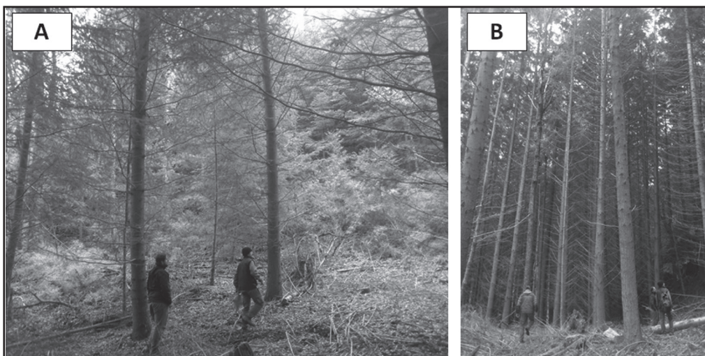
Figura 1: Fotografías mostrando dos condiciones contrastantes de forestación con pino Oregon en Patagonia, A) baja densidad de plantación y B) alta densidad de plantación.

Mediante un enfoque dendroecológico en ambas especies trabajamos en sitios con alta y baja disponibilidad de agua, en términos relativos uno de otro. El sitio, con BAJA disponibilidad fue la estancia Yanov-Lazzarini, a 20 km de la localidad de San Carlos de Bariloche ( 41^{\circ} 13' 38'' S ; 71^{\circ} 14' 39'' O ), con una precipitación media anual de 800 mm. El sitio con ALTA disponibilidad fue la estancia Quechuquina, a 30 km de San Martin de los Andes ( 40^{\circ} 9' 66'' S ; 71^{\circ} 33' 41'' O ), con una precipitación media anual de 1390 mm. Cabe destacar que la edad de los árboles dentro de cada sitio era similar, pero no entre sitios, siendo de mayor edad y diámetro los individuos del segundo sitio.