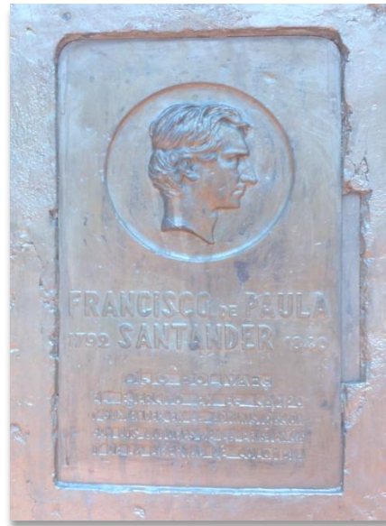
Ilustración 14. Monumento a Santander

Este monumento fue hecho en honor a uno de los dirigentes de la independencia colombiana con el fin de representar la libertad de los campos en Colombia. Se escoge la figura de Francisco de Paula Santander ya que Simón Bolívar lo deja a cargo de su ejército en el campo.