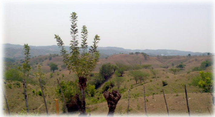
Ilustración 26. Panorámica de las veredas del Guamo

colinas y montañas que permiten al visitante hacer un recorrido ecológico en el que se puede experimentar la frescura del campo al aire libre.