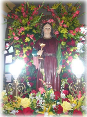
Ilustración 11. Altar a Santa Lucia