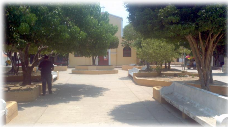
Ilustración 17. Parque Santa Lucia

Se encuentra ubicado en la parte central, al frente del templo. Este parque se convierte todos los años en punto de encuentro de la gente del Guamo durante las fiestas. En las fiestas patronales de San Antonio y Santa Lucia la gente se ubica en las bancas para descansar después de una rueda de fandango, observando la panorámica del templo y arquitectura de las casas que quedan a su alrededor.