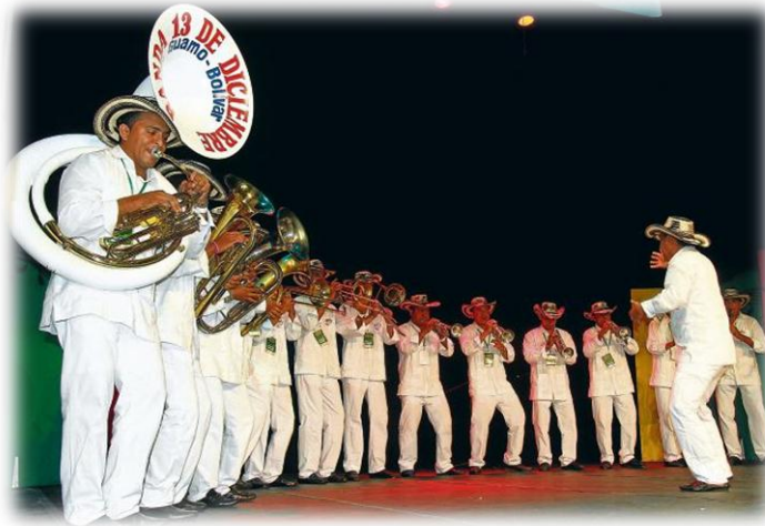
Ilustración 20. Banda “Trece de Diciembre”

La banda “trece de diciembre” conformada por músicos del Guamo, son especialistas en la música tradicional del Guamo es decir la música de banda, como el Fandango y el Porro. Estos músicos, con un extraordinario talento, representan parte de las expresiones culturales del municipio, quienes por su talento han sido ganadores de la primera versión del Festival de Bandas de Bolívar 2013, ahora se preparan para obtener un reconocimiento internacional y llevar más allá de las fronteras la música de la región.