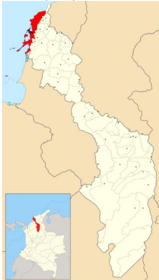
Ilustración 1. Mapa departamento de Bolívar.

Colombia es un país con un gran potencial turístico que todavía permanece oculto y no está siendo aprovechado. Tan solo el mercado del turismo receptivo 1 en Colombia registró durante el primer bimestre del 2014 - por las fronteras aéreas, marítimas y terrestres- 461.812 llegadas de viajeros no residentes, 8,5% más que en el mismo período de 2013 (425.588). Subdivididos de la siguiente forma: 302.783 fueron extranjeros no residentes, 87.743 fueron pasajeros en cruceros, 71.286 fueron colombianos no residentes en el país. Según pronósticos de la Oficina de Estudios Económicos, el crecimiento anual esperado en la variable llegadas de extranjeros no residentes para febrero el primer trimestre de 2014 está entre 7,5% y 8,5%. Para 2014 el crecimiento previsto está entre 10,5% y 12,5%, mayor al registrado en 2013 (8,5%) (Min CIT, 2014).