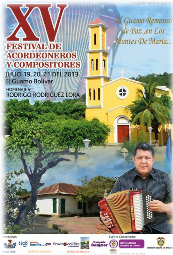
Ilustración 19. Afiche promocional del XV Festival de Acordeoneros y compositores