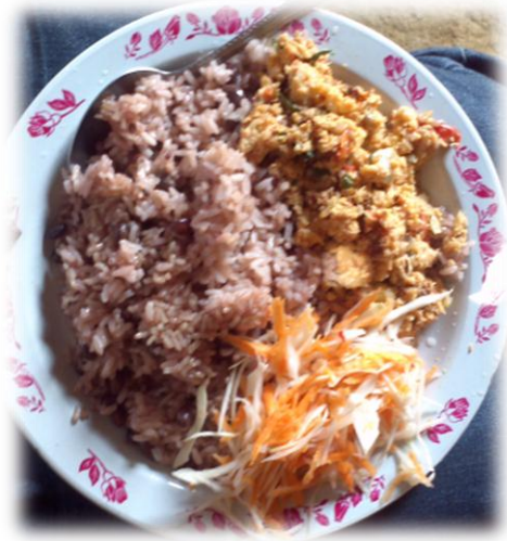
Ilustración 24. Gastronomía