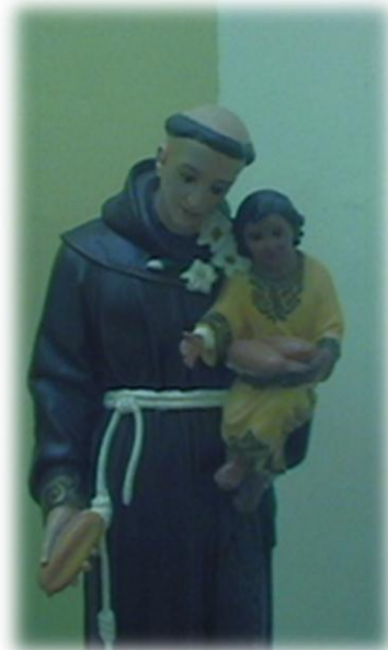
Ilustración 25. San Antonio

Los devotos le realizan la fiesta todos los años, empezando con una alborada musical a partir de las 4:30 de la mañana, recorrido por las principales calles de la población al son de la banda de viento del municipio, después una solemne misa a partir de las 10:00 de la mañana en donde los feligreses participan en oraciones y cantos. En las horas de la tarde, a partir de las cinco empieza la procesión en donde llevan al santo cargado y decorado con flores al son de ritmos religiosos entonados por la banda Trece de Diciembre de El Guamo.