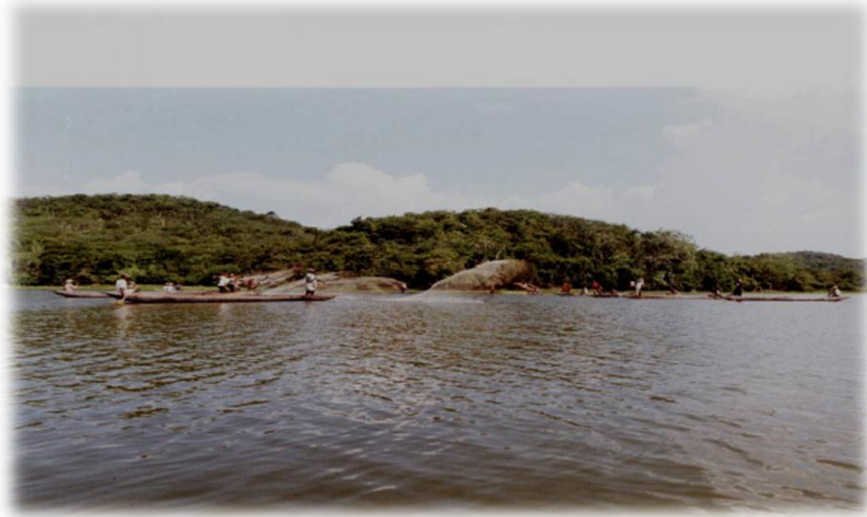
Ilustración 28. Ciénaga de la Candelaria o Nervití