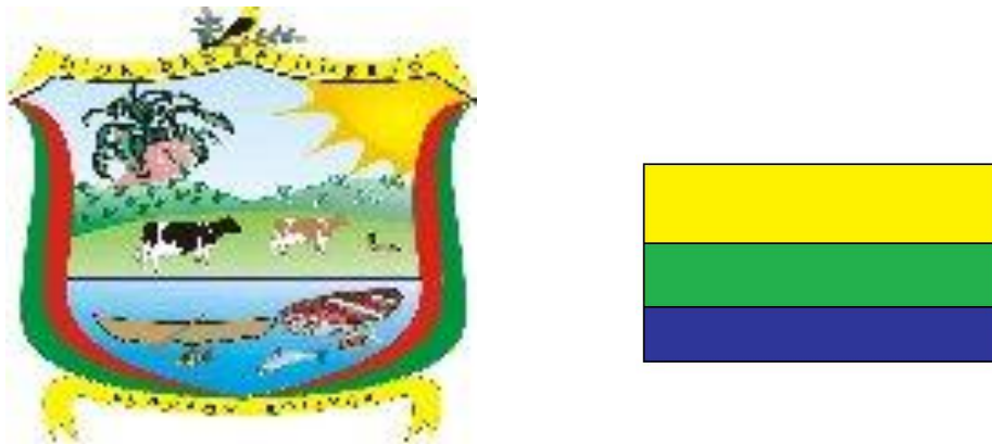
Ilustración 5 Escudo y bandera.

Los símbolos del Guamo son su escudo y su bandera que representan el legado histórico del municipio.