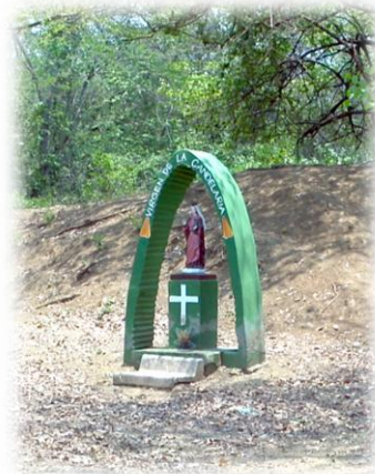
Ilustración 15. Altar a la Virgen de La Candelaria

Este altar ubicado en el barrio Paraíso todos los años para el 2 de febrero es un centro de reunión de los Guameros, donde se organiza la Fiesta de la Virgen de la Candelaria; estos se reúnen cerca al pozo, lugar donde se encuentra ubicada la virgen.