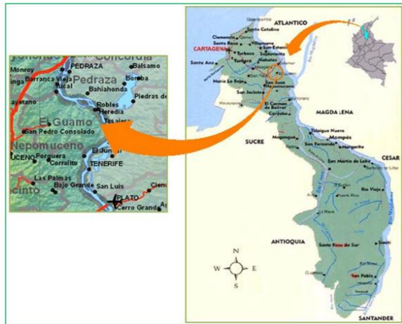
Ilustración 4 Localización geográfica del municipio de Guamo

vierten sus aguas a las ciénagas ubicadas en los márgenes del río Magdalena.