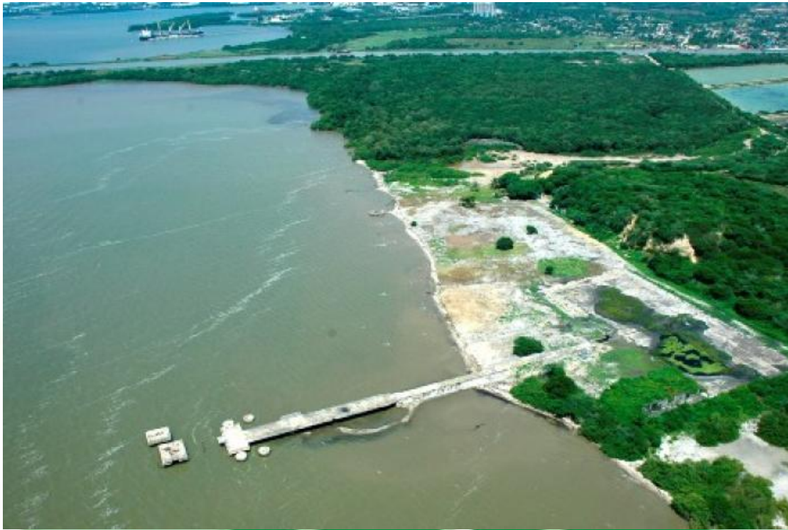
Foto 1. Zona de ubicación de Puerto Bahía

Fuente: El Universal de Cartagena, Marzo de 2011