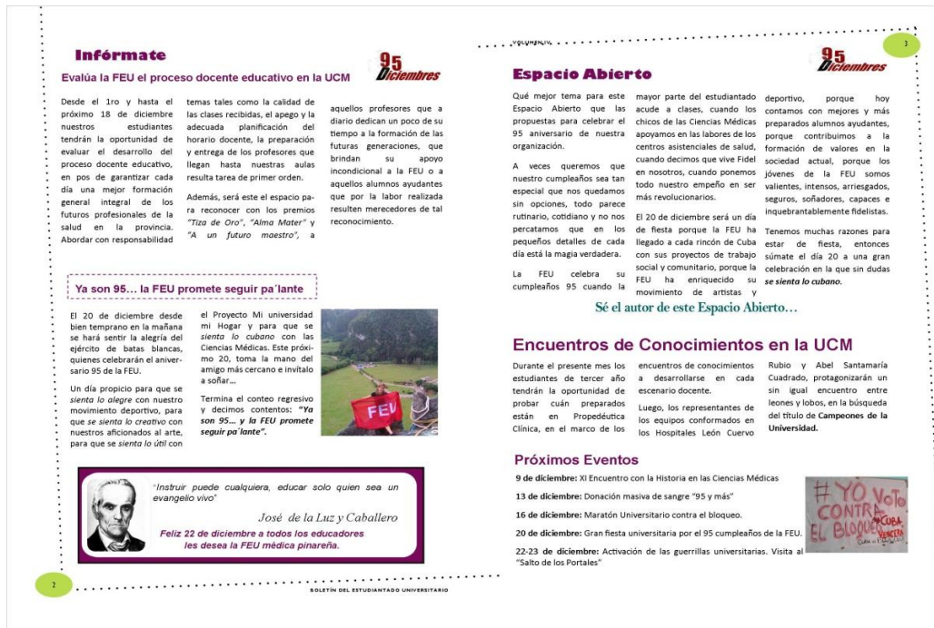
Figura 2. Boletín “95 Diciembres” (1ra edición). Páginas 2 y 3 del volumen IV

Página 2: en el borde superior derecho se encuentra el nombre del producto. En esta página se encuentra la sección “Infórmate”, donde se ubican notas informativas sobre procesos que se llevan a cabo en la universidad. En la parte inferior se ubica una frase relacionada con la temática central del boletín (figura 2).