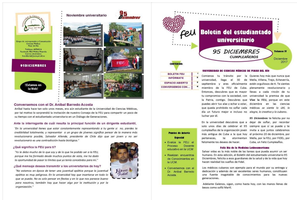
Figura 1. Boletín “95 Diciembres” (1ra edición). Páginas 1 y 4 del volumen IV

Página 1: en el borde superior se encuentra en posición horizontal el nombre del producto “95 Diciembres”, a la izquierda de este el logo de la campaña por el 95 aniversario de la FEU, y a la derecha el número de volumen correspondiente, mes y año. En el borde superior izquierdo se encuentra una tabla de contenido donde se muestran las secciones del producto; a la izquierda de esta tabla se encuentra el boletín del mes en curso donde se transmite el tema central de la edición. En el borde inferior izquierdo se encuentra un recuadro donde se colocan los elementos sobre los que se desea llamar la atención del estudiantado; a la derecha se ofrece información de interés especial sobre alguna actividad próxima a realizarse, acompañada de imágenes que le dan una visión más atractiva al mensaje (figura 1).