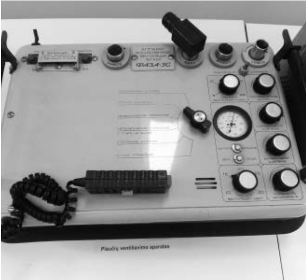
Plaučių ventiliavimo aparatas

Taip, eksponatai suskirstyti pagal tam tikras sritis. Pirmiausia sudėliojome nuotraukas ir rašytinę informaciją. Šie eksponatai pateikti pagal ligoninėje veikusias ir šiuo metu veikiančias klinikas: Akušerijos ir ginekologijos, Vaikų ligų, Širdies ir kraujagyslių, Terapinis bei Diagnostinis skyriai. Kita eksponatų dalis – medicininiai instrumentai ir aparatūra – išdėstyta taip, kad jie būtų nors kiek susiję su tos klinikos, kuri eksponuojama nuotraukose, specifika.