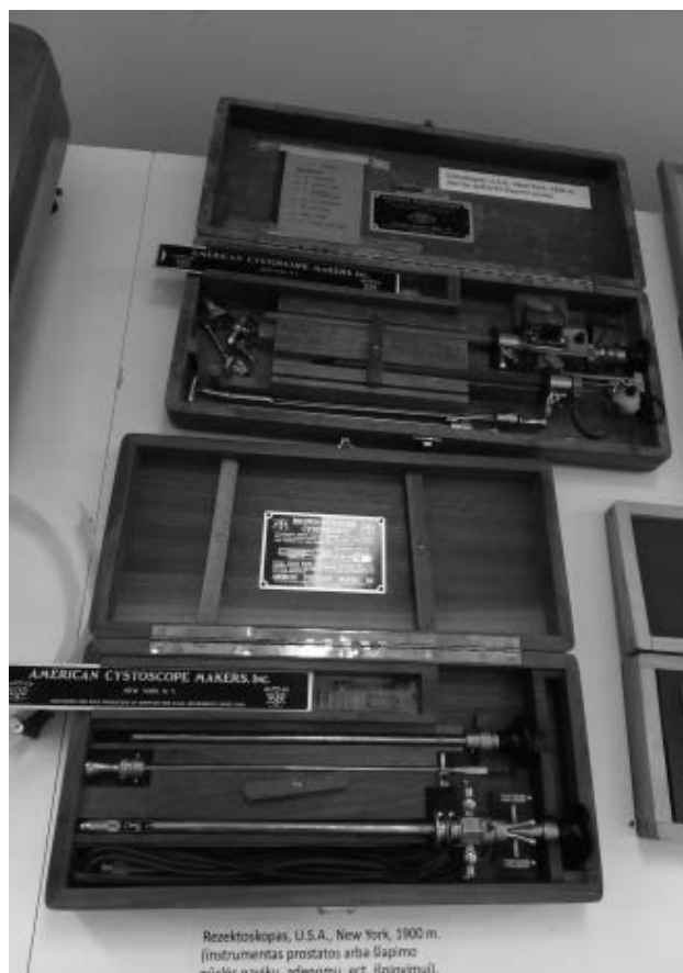
JAV 1900 m. pagamintas cistoskopas (apačioje) ir rezektoskopas

Kaip minėjau, iš pradžių, pradėjusi kaupti nebereikalingus medicininius instrumentus, net nemaniau, kad jie taps muziejiniiais eksponatais, tad ir išankstinės muziejaus vizijos neturėjau. Šiuo metu muziejuje esančių eksponatų – rašyti-