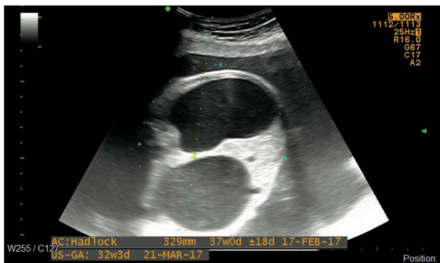
Figura 4. Embarazo de 31,5 semanas, signo de doble burbuja intraabdominal, corte transversal abdominal.