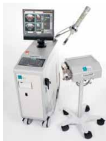
Fig.2. Sonablate HIFU

Ablatherm HIFU a fost dezvoltat în 1989 în Franța, prin colaborarea dintre Institutul Național de Cercetare Medicală, spitalul Edouard Herriot Lyon și EDAP TMS.