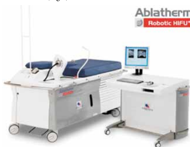
Fig.1. Ablatherm HIFU

La ora actuală sunt folosite, la nivel mondial, două dispozitive de ablație termică pentru tratamentul cancerului de prostată localizat, Ablatherm Robotic HIFU (Fig.1) și Sonablate 500 V4 TCM. (Fig.2)