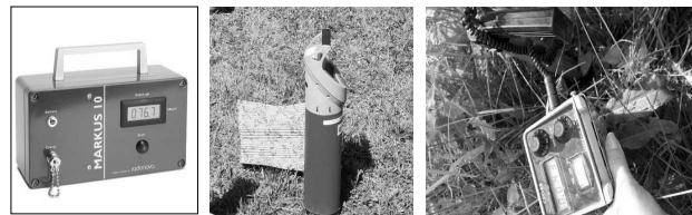
Figura 1. Echipamente moderne de monitorizare a radioactivității naturale din sol și a ratei dozei gamma: emanometrul "Markus 10", spectrometrul gamma cu detector "Gamma-Ray GPX-21A" și radiometrul "CPP-88H"

Utilizarea echipamentului de măsurare a radonului, tehnicile și procedurile de evaluare anuală a radioactivității radonului și o analiză comparativă a variațiilor radonului reprezintă o experiență unică pentru Estonia. Lucrările în teren au fost efectuate cu echipamente care au fost calibrate și verificate lunar de către producător, constituite din: emanometrul Markus 10 , spectrometrul gamma cu detector Gamma-Ray GPX-21A și radiometrul CPP-88H (figura 1).