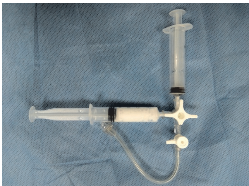
Fig. 1 Prepararea spumei sclerozante după metoda Tessari.

In vitro experimental study of the stability of sclerosing foam was conducted in the room with constant temperature of 21 \pm 0.5^\circ\text{C} and relative humidity of 90%, monitored by digital thermometer and psychrometric hygrometer. Sclerosing foam was prepared by the same person (VC), with large experience in utilization of the Tessari method. One millilitre of liquid sclerosing agent – sodium tetradecyl sulfate (STS), produced by Laboratoires Innothéra (Arcueil, France) under the brand name Trombovar ® , was mixed with atmospheric air using two syringes connected via three-way-stopcock with 7.0 cm extension tube and valve (CE0086; BD Connecta ™ , Luer-Lok ™ , Becton Dickinson Infusion Therapy AB, Helsingborg, Sweden) (Figure 1). The tap of connector was not rotated between experiments in order to not change the inner diameter and thus not influence the results of repeated evaluations. At the end of foam preparation the entire volume of foam was pumped in one from two syringes and this one was cautiously disconnected from the three-way-stopcock. At that moment the plunger was slightly pulled back to prevent the spontaneous leakage of the foam. Immediately, syringe was placed on a rough surface in a vertical position with plunger down and “foam half-life” (FHL) was recorded in seconds using the same digital chronometer for all experiments. The FHL was defined as a time interval from the moment of stopping the foam preparation till transformation of the foam into the sy-