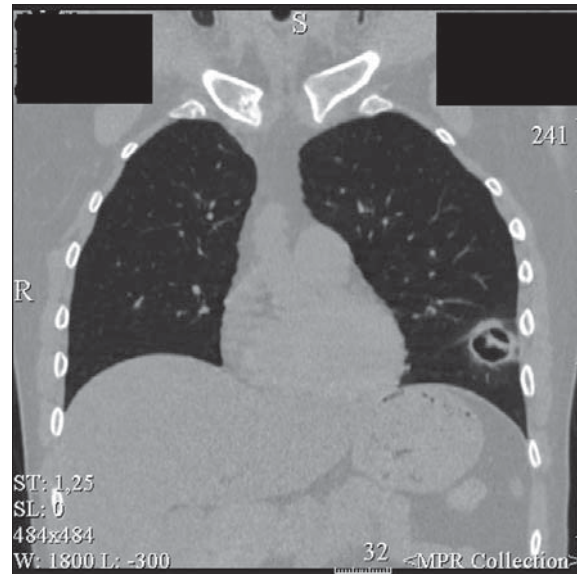
Fig. 2 Secțiune computer-tomografică a plămânilor unui pacient cu aspergiloză probabil invazivă.

Fig. 1 Sputum microscopy photograph from a patient with a probable invasive aspergillosis.