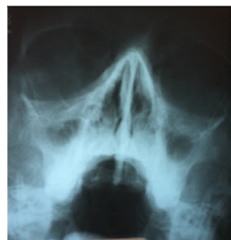
Fig. 2. R-grafia sinusurilor paranasale. Sinuzită maxilară, bilaterală.

Examenul radiologic al cutiei toracice în diferite perioade de timp evidențiază opacități rău definite pulmonare nodulare, difuze, bilateral, cu pierderea de claritate în ambele hemidiafragme cu revărsat pleural și fibroză pulmonară (fig. 1),