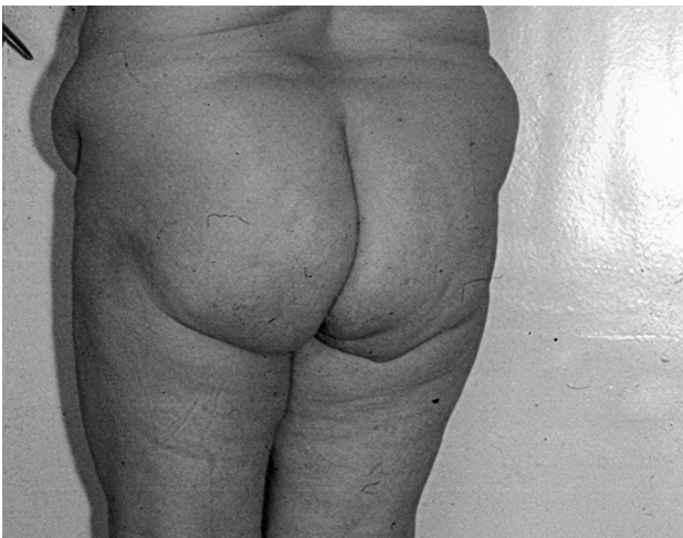
Figura 4. Plaga postoperatorie cicatrizată per primam

Poarta herniară de dimensiuni 12 cm, cu atrofia țesutului musculoaponeurotic în jurul porții herniare, cu pierdere de substanță. Conținutul sacului herniar – ansele intestinului subțire și epiplonul mare. Perioada postoperatorie fără particularități. Plaga s-a cicatrizat per primam. La distanță de 18 ani, recidiva herniei nu s-a înregistrat (figura 4).