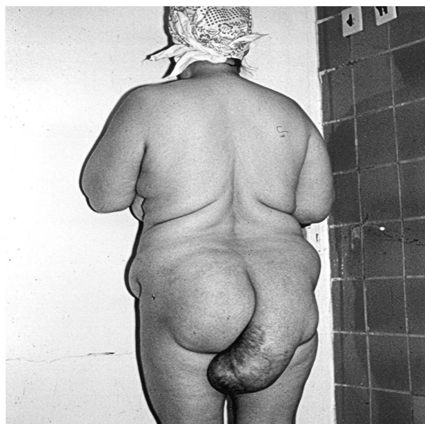
Figura 1. Hernie perineală posterioară recidivată

Cu aceste acuze a fost spitalizată în Clinica de chirurgie nr. 3, SCM Sf. Treime (mun. Chișinău), pentru examinare și tratament chirurgical. La examinare, în regiunea perineală pe dreapta se depistează o formațiune voluminoasă (35x25 cm), elastică, reductibilă, nedureroasă, care prolabează până la treimea superioară a feței posterioare a femurului drept. După repunerea herniei în bazinul mic, poarta herniară permite 4-5 degete (10-12 cm) (figurile 1, 2).