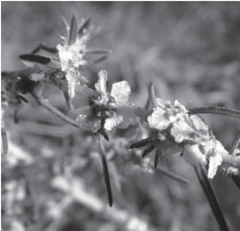
Bassia laniflora - H. Signoret

La Bassie à fleurs laineuses ( Bassia laniflora - espèce protégée au niveau régional et inscrite au Livre rouge National tome I) est une plante annuelle steppique d'Europe de l'Est se développant sur des zones sableuses arides avec très peu de concurrence végétale. Le Calavon est l'un des derniers sites connus accueillant cette espèce rare en France (19 stations dont 15 sur le Calavon).