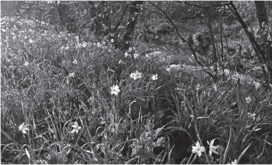
Les prairies naturelles de fauche en bordure de l'Encrème riches en Narcisse des Poètes.