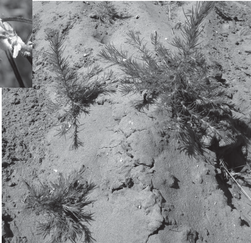
Bassia laniflora

La Bassie à fleurs laineuses ( Bassia laniflora - espèce protégée au niveau régional et inscrite au Livre rouge National tome I) est une plante annuelle steppique d'Europe de l'Est se développant sur des zones sableuses arides avec très peu de concurrence végétale. Le Calavon est l'un des derniers sites connus accueillant cette espèce rare en France (19 stations dont 15 sur le Calavon).