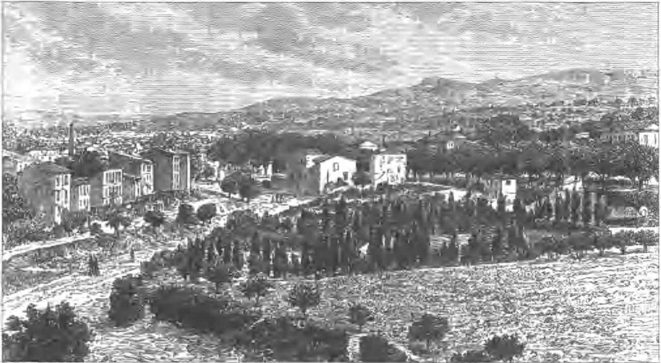
Apt, (dessin de 1880) in Département de Vaucluse d'Adolphe Johanne, p. 49.