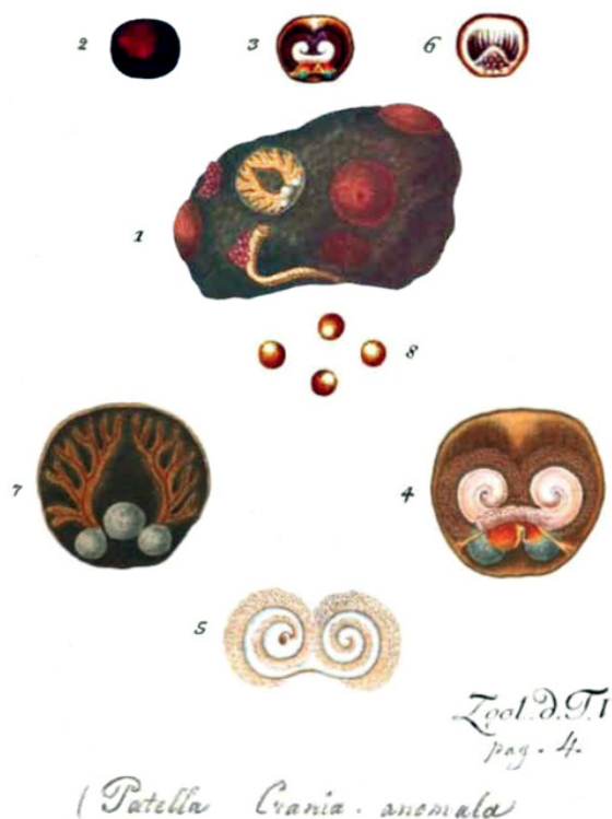
Figure 3 : Fac-similé des figures sur Patella - Crania anomala de la planche de MÜLLER (1788), avec les légendes originales (en p. 4 comme indiqué sur la figure) ci-dessous.

Figure 3: Extract in facsimile of the figures on Patella - Crania anomala of MÜLLER's (1788) plate, with original captions (on p. 4 as stated on the figure) below.