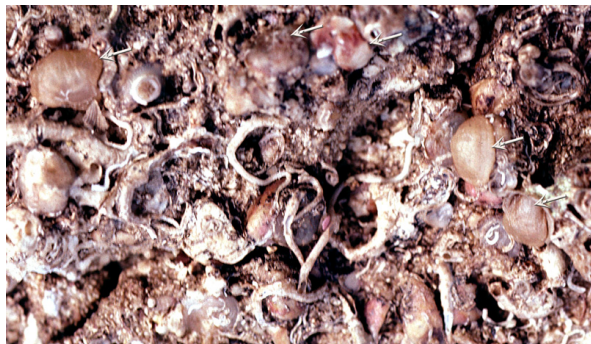
Figure 4 : Fond rocheux avec des Novocrania anomala (flèches) dans l'étage Bathyal supérieur près de Calvi (Corse) à 210 m de profondeur. On distingue aussi quelques anciennes valves ventrales.

Table 1 : Type locality and synonyms for both species Novocrania anomala and N. turbinata . Craniids species have often been described under the genus names Patella , Anomia or Orbicula . Later they were placed in the genus Crania RETZIUS, 1781 (see EMIG, 2009). Then, LEE & BRUNTON (1986) created the genus Neocrania for the living species, changed to Novocrania LEE & BRUNTON, 2001.