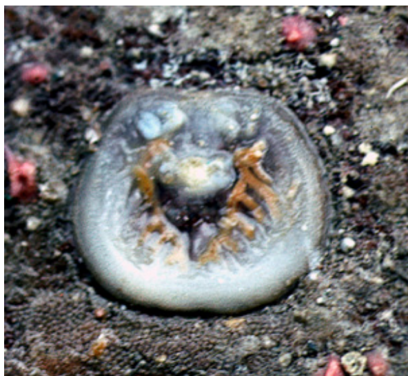
Figure 5 : Valve ventrale de Novocrania anomala sur un fond rocheux vers 120 m de profondeur au large d'Avilés (Golfe de Gascogne, Espagne : Campagne Fauna II, juin 1991, programme Fauna Ibérica, N/O García del Cid).

Figure 5: Ventral valve of Novocrania anomala on a rocky bottom at 120 m depth off Avilés (Bay of Biscay, Spain: Fauna II Expedition, June 1991, Fauna Ibérica program, R/V García del Cid).