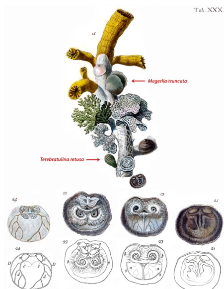
Figure 1 : Extrait en fac-similé des figures sur Anomia turbinata (Anomie Conique) de la Planche XXX de POLI (1795), avec les légendes originales.

Figure 1: Extract in facsimile of the figures on Anomia turbinata (Conical Anomie) of the Plate XXX of POLI (1795), with the original captions.