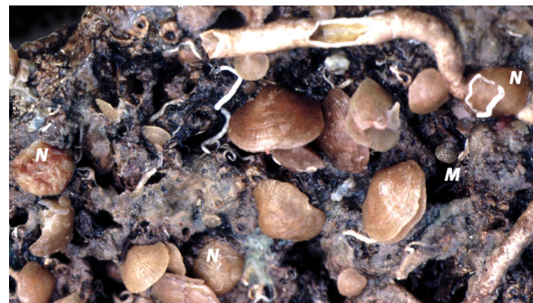
Figure 2 : Fond rocheux dans le Bathyal supérieur (255 m de profondeur) au large de l'Ile de Porquerolles (Provence, France) avec des Novocrania anomala (N), des Megathiris detruncata (M) et de nombreuses Megerlia truncata , dont certaines présentent la forme monstruosa avec déformation de la coquille en fonction du substrat. Ces espèces se trouvent aussi sur des branches du scléactiniaire Dendrophyllia cornigera (Pl. 1).

En l'absence d'une diagnose vraie (voir Commission Internationale de Nomenclature Zoologique, 1999, et Conclusion) permettant d'identifier Novocrania anomala et N. turbinata , l'usage du nom de l'une ou de l'autre a toujours été laissé à l'appréciation de l'auteur qui identifiait des cranes de Méditerranée. En fait, les auteurs méditerranéens souvent rapportaient leurs cranes à turbinata , car elle représentait une forme