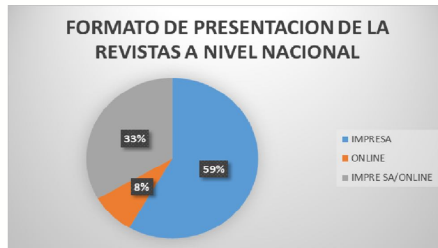
Gráfica. 6 Formato de presentación de revistas nacionales.

No obstante en la región Orinoquia las universidades no se han preocupado por la innovación en la tecnología digital, ya que es un medio para que la comunidad académica logre divulgar trabajos académicos y de investigación; el anterior análisis se obtuvo por la investigación sobre revistas académicas electrónicas dirigidas a la administración y negocios, realizada en la web y en las universidades: Unimeta, Ideas, San Martín, Uniminuto, Santo Tomás, Universidad Cooperativa, entre otras universidades existentes en el Meta.