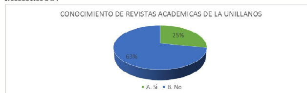
Gráfica. 7 Conocimiento de revistas académicas de la unillanos.

Aunque se encontró una revista impresa que está actualmente editada por la corporación universitaria ideas llamada revista Money and Business de la facultad de ciencias administrativas. Asimismo se encontró que la universidad de los llanos cuenta con dos revistas digitales; la primera está dirigida por la Facultad de Ciencia Básicas e Ingeniería (Revista BI), y la otra es la por la Facultad de Ciencia Agropecuarias y Recursos Naturales (Revista Orinoquia). Es importante recalcar que los estudiantes, profesores y personas interesadas en adquirir conocimientos conozcan el fin de las revistas académicas tema ya mencionado, aunque la percepción que se tiene de las revistas de la universidad de los llanos es muy nula, la anterior afirmación se basa en una encuesta realizada que arrojó que el 62% de los estudiantes no tenían conocimiento de la existencia de estas revistas (véase en la gráfica 7) de aquí, se llega a la conclusión que hay falta de comunicación y de interés por parte de la comunidad académica en hacer partícipe de los medios tecnológicos que se tienen en la universidad sumado el que no se hacen uso de las herramientas pedagógicas.