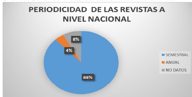
Gráfica. 5 Periodicidad de las revistas nacionales.

A nivel nacional las revistas académicas utilizan dos tipos de periodicidad que son semestral, anual y en algunos casos no se identificaron dicha periodicidad, de esta forma se puede analizar que el 88% de las revistas académicas de administración y negocios desarrollan una periodicidad semestral, ya que su periodo académico dura seis meses y esto conlleva a que en el semestre se cree nueva información con relación en el periodo que se esté cursando. (Véase en la gráfica 5).