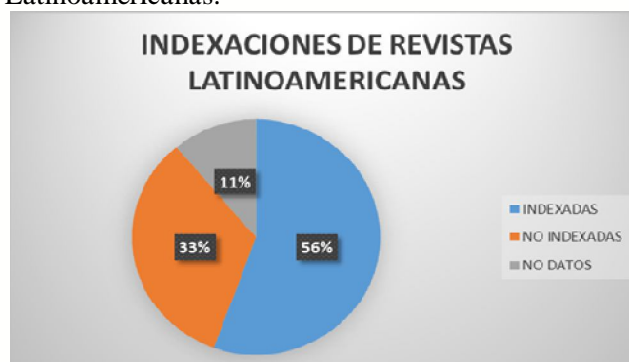
Grafica. 3 Indexaciones de revistas Latinoamericanas.

determinado, este conocimiento debe en realidad impactar en la sociedad. En Colombia las revistas enfocadas a la administración y negocios en ciudades como: Cartagena, Bogotá, Cali, Neiva, Santa marta, Medellín, Antioquia, Tolima, Barranquilla y Bucaramanga, enfatizan en temas como innovación y cambio tecnológico, organizaciones, responsabilidad social empresarial, gestión de la calidad, dirección estratégica, emprendimiento, competitividad, Administración y gestión del talento humano y liderazgo, ética y responsabilidad social entre otros temas administrativos.