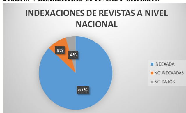
Grafica. 4 Indexaciones de revista Nacionales.

Las revistas en Colombia son indexadas por el Departamento Administrativo de Ciencia, Tecnología e Innovación (Colciencias), por medio de IBN-PUBLIDEX, el cual certifica y da el sello de calidad y de credibilidad a la revista académica, con lo anterior se observa que en Colombia el 87% de las revistas están indexadas y cumplen con los requisitos que solicita PLUBLIDEX, del 11% restante el 9% se encuentran en procesos y el 4% no se encuentra especificado si pertenece a la revistas indexadas (véase en la gráfica 4).