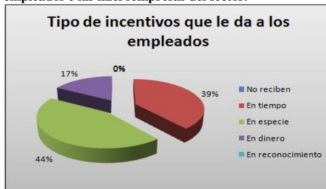
Gráfica 4. Tipos de incentivos con que cuentan los empleados e las microempresas del sector.

Teniendo en cuenta la gráfica 4 las microempresas del sector encuestadas proporcionan un 44% de incentivos en especie a sus empleados, un 39% de encuestados brindan a sus empleados como incentivo tiempo, un 17% proveen a sus empleados dinero como incentivo por su trabajo, según los resultados de la encuesta ninguna microempresa ofrece incentivos de reconocimiento.