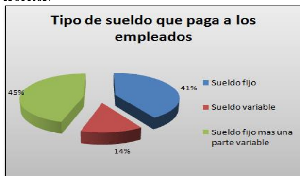
Gráfica 2. Tipos de sueldo pagado a los empleados en el sector.

Teniendo en cuenta los resultados obtenidos en la gráfica 1 de la aplicación del censo se pudo evidenciar con esta primera pregunta que el principal foco de comercio en el sector de estudio concierne a los alimentos, sumando sus dos mayores exponentes el 52% (Restaurante-Comidas Rápidas y Supermercado –Tienda), mientras que minoristas como las papelerías (18%), salas de belleza (14%) y droguerías (10%) se encuentran en segunda línea pero con participación conjunta muy fuerte (42%). Teniendo en cuenta que el censo de población nos dio un total de 95 establecimientos de comercio en dicho sector.