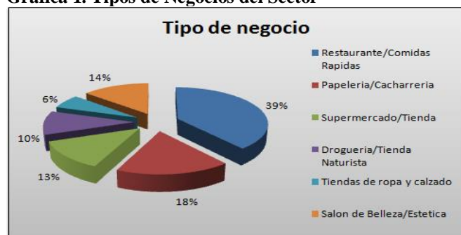
Gráfica 1. Tipos de Negocios del Sector