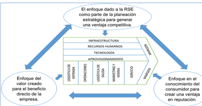
Figura 3. Integración de los enfoques con la cadena de valor