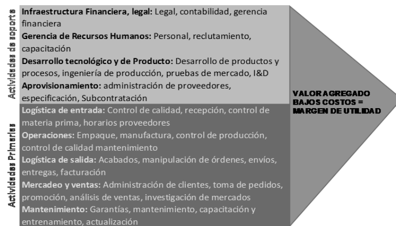
Figura 1. Cadena de valor.

Porter y Kramer (2006) definen la cadena de valor de las empresas (ver figura 1), como todas las actividades primarias y de apoyo que intervienen en el desempeño organizacional y contribuyen a las metas propuestas por la filosofía empresarial del gobierno corporativo. Este concepto a su vez se transforma en una herramienta estratégica que puede utilizarse para identificar oportunidades de impacto social en los grupos de interés y así establecer prácticas confiables en todos los eslabones de la cadena; lo que implica que las empresas sean más eficientes en la gestión de las contingencias y así puedan generar una ventaja competitiva en costo, inventario o flujo de caja.