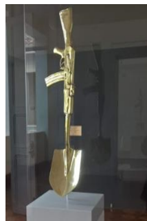
Anexo 2: Escultura “Metamorfosis”

Fuente. Fotografía tomada por los autores a la escultura titulada “Metamorfosis”, creada por el artista Alex Sastoque y expuesta en el Museo Militar de Colombia.