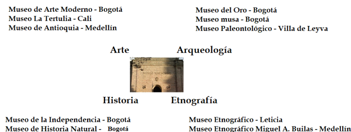
Figura 2: Ubicación de los museos en torno a las temáticas del Museo Nacional de Colombia