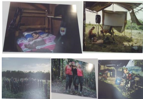
Anexo 1: Tomas de excombatientes

Fuente. Collage realizado por los autores con las fotografías expuestas en la exposición “La esperanza vence el miedo” del Museo Nacional de Colombia en el 2017.