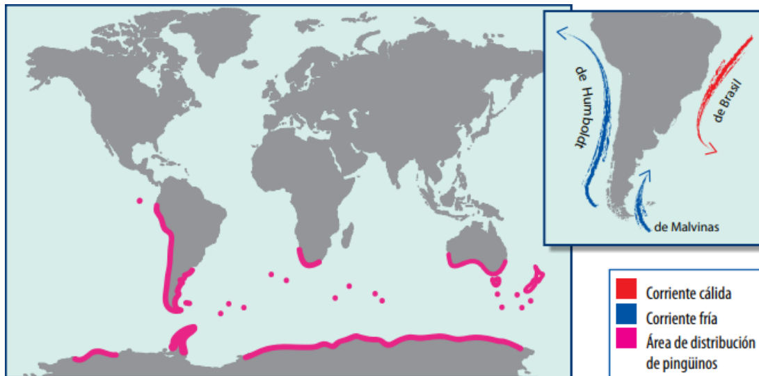
Figura 4. Distribución mundial de las 18 especies de pingüinos actualmente existentes.

En este sentido, cabe recalcar que cada migración y adaptación por la que pasa una especie no siempre es fácil, y más cuando se trata de un ecosistema con hábitats y nichos potenciales diferentes al de su origen. En la actualidad, los pingüinos, a pesar de todas las adaptaciones por las que han pasado, se ven sensibles a un último, reciente e inesperado escenario: los cambios antropogénicos que se están generando a nivel local y planetario.