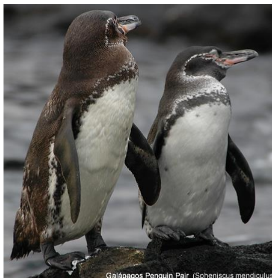
Figura 3. Apariencia de pingüinos adultos de Galápagos: Hembra (lado derecho) y macho (lado izquierdo).