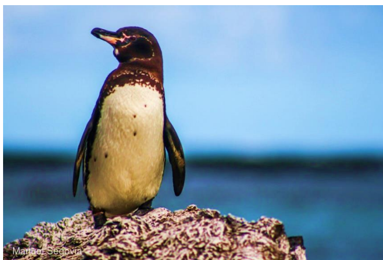
Figura 2. Individuo adulto de Spheniscus mendiculus .

Los pingüinos juveniles no tienen color negro, de hecho, son grises, aún no se les marca las líneas blancas faciales y de igual manera la del vientre. Por esta característica muestran espacios de color blanco en las partes laterales de la cabeza, específicamente en las mejillas y parte de la barbilla (Boersma, 1977; Castro & Phillips, 1996; Bungham, 2000). El pico de un individuo juvenil es mucho más oscuro que el de un adulto, por esto no tienen la línea o banda amarilla en la parte inferior de la mandíbula (Bungham, 2000). Con respecto al color de los ojos, varía según la edad del individuo: en un juvenil son grises oscuros y en un adulto generalmente rosado-claros (Boersma, 1977; Bungham, 2000).